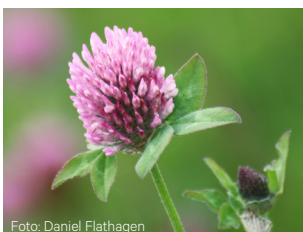
Rødkløver Trifolium pratense