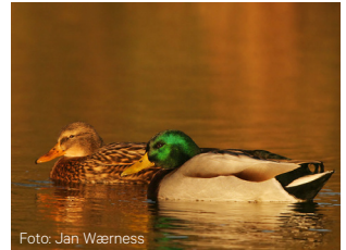
Stokkand Anas platyrhynchos