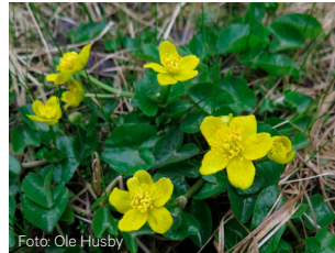
Bekkeblom Caltha palustris