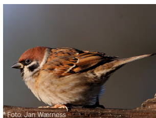
Pilfink Passer montanus