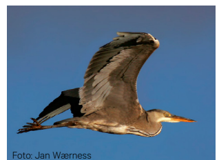
Gråhegre Ardea cinerea