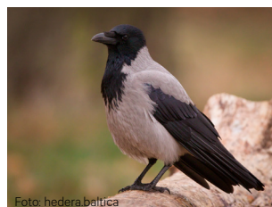
Kråke Corvus cornix