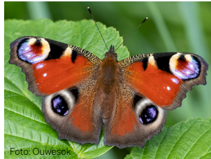
Dagpåfugløyve Aglais io