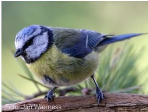
Blåmeis Cyanistes caeruleus