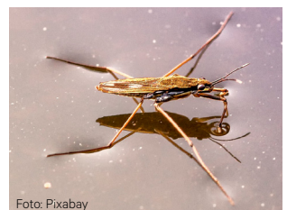
Vannløper Familie: Gerridae