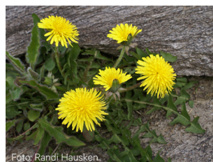
Løvetann Taraxacum officinale