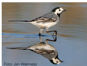
Linerle Motacilla alba