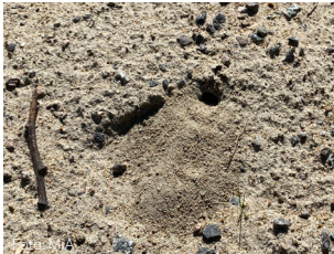
Hull etter sandbie