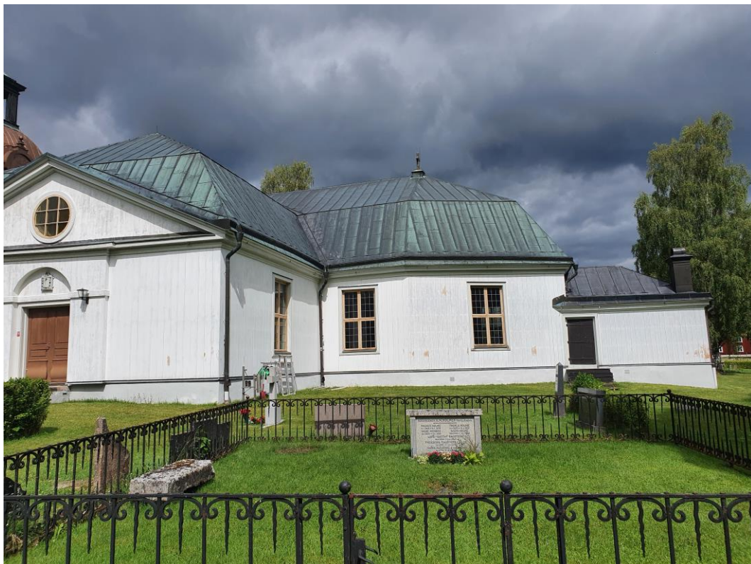
Under arbetets gång. Södra sidan av kyrkan. Fasaderna har tvättats och skrapning har påbörjats.

Färgen hade ett mycket ovanligt beteende/utseende på främst södra sidan och målarna kunde inte säga varför den såg ut som den gjorde. Eftersom färgen satt så dåligt togs beslutet att på södra sidan skrapa fasaderna trärena, för att få ett bra fäste för den nya färgen samt för att bli av med plastfärgen.