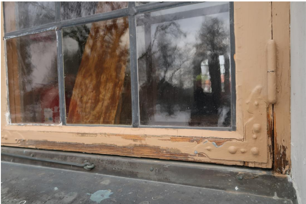
Fönster och fönsterbågar före åtgärder. En båge har provskrapats.