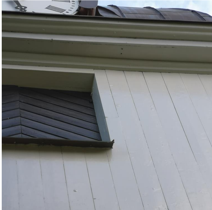
Linoljeblåsor uppstod på tornets västra sida.

Arbetena godkändes ur antikvarisk synpunkt, vid slutbesiktningen. Då hade det upptäckts några linoljeblåsor på tornets västra fasad, långt upp vid ljudluckorna. I samråd med entreprenör, fastighetsförvaltare och församling beslöts att åtgärda dem nästa år då temperaturen börjat sjunka och vädret inte längre var det bästa för målningsarbeten.