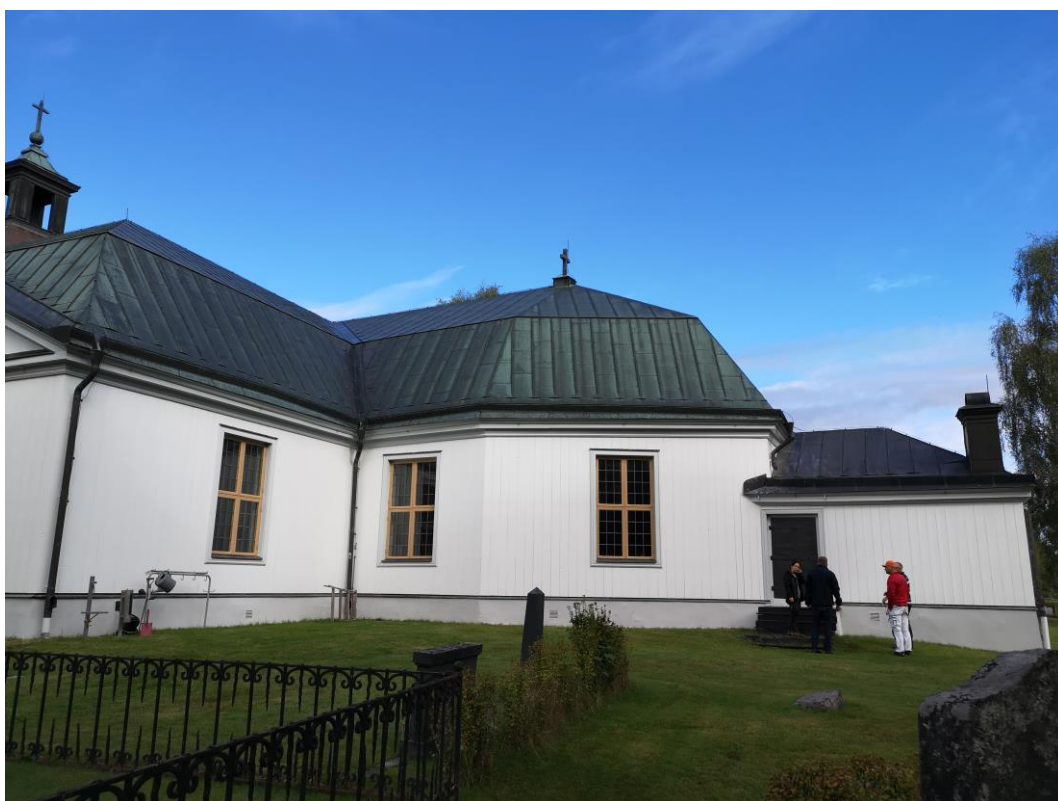
Sydöstra sidan efter målningsarbeten. På korfasaden, närmast korsarmen satt tidigare plastfärg.