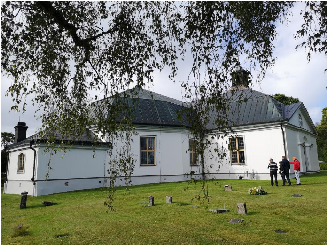
Norra sidan av Järnboås kyrka efter målningsarbeten.