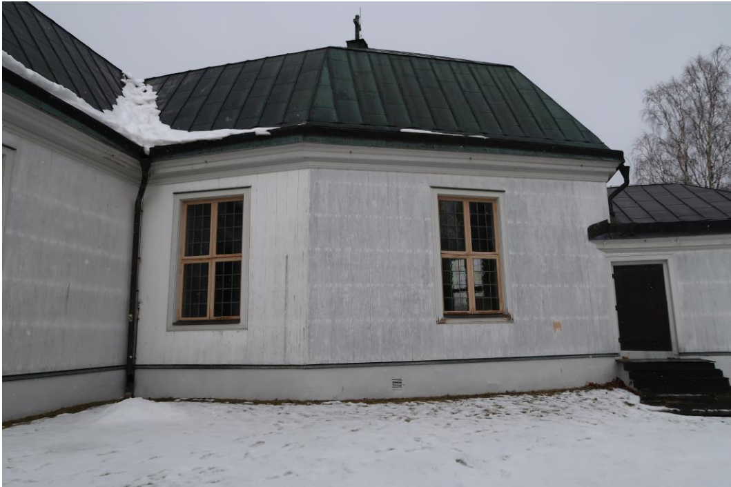
Koret före åtgärder.