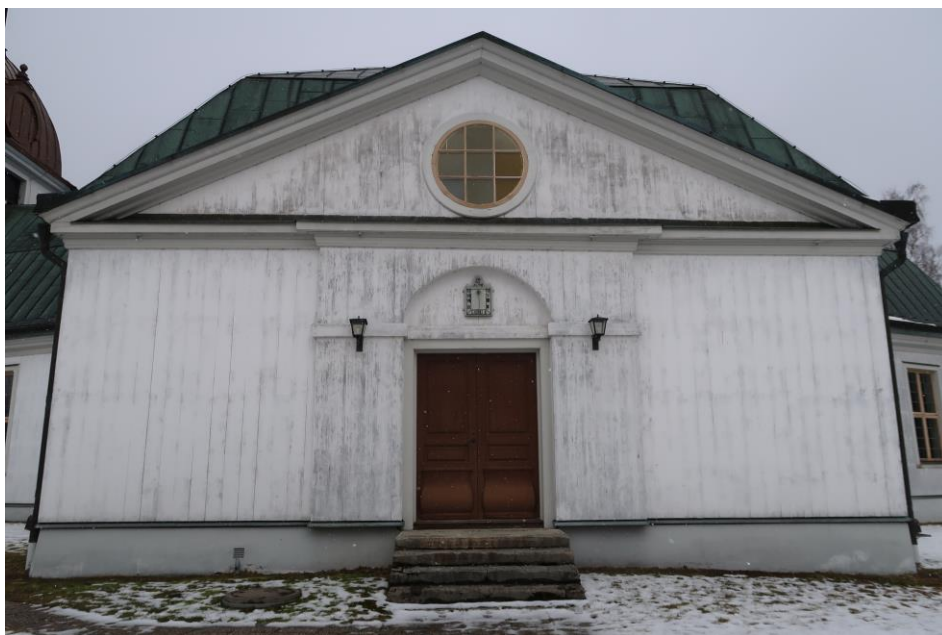
Järnboås kyrka före åtgärder. Södra sidan av kyrkan och tornet.