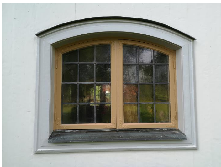
Fönster efter arbeten.

Fönsterbågar och karmar var i gott skick. De var i så gott skick att de åtgärdades bara på utsidan. Sidor/kanter på bågar och karmar var i mycket gott skick. Att måla bara för att måla bedömdes som omotiverat då det också bygger onödiga färglager. Några bågar var fastmålade, de öppnades inte. Utsidan på bågar och karmar tvättades, skrapades och kittades med linoljekitt vid behov. De målades sedan med en ljus ockragul linoljefärg av märket Lasol i kulören NCS S3020-Y30R, först fläckgrundades de med förtunnad färg och en mellanstrykning sedan slutströks bågar och karmar med oförtunnad färg. Färgen förtunnades enligt tillverkarens anvisningar.