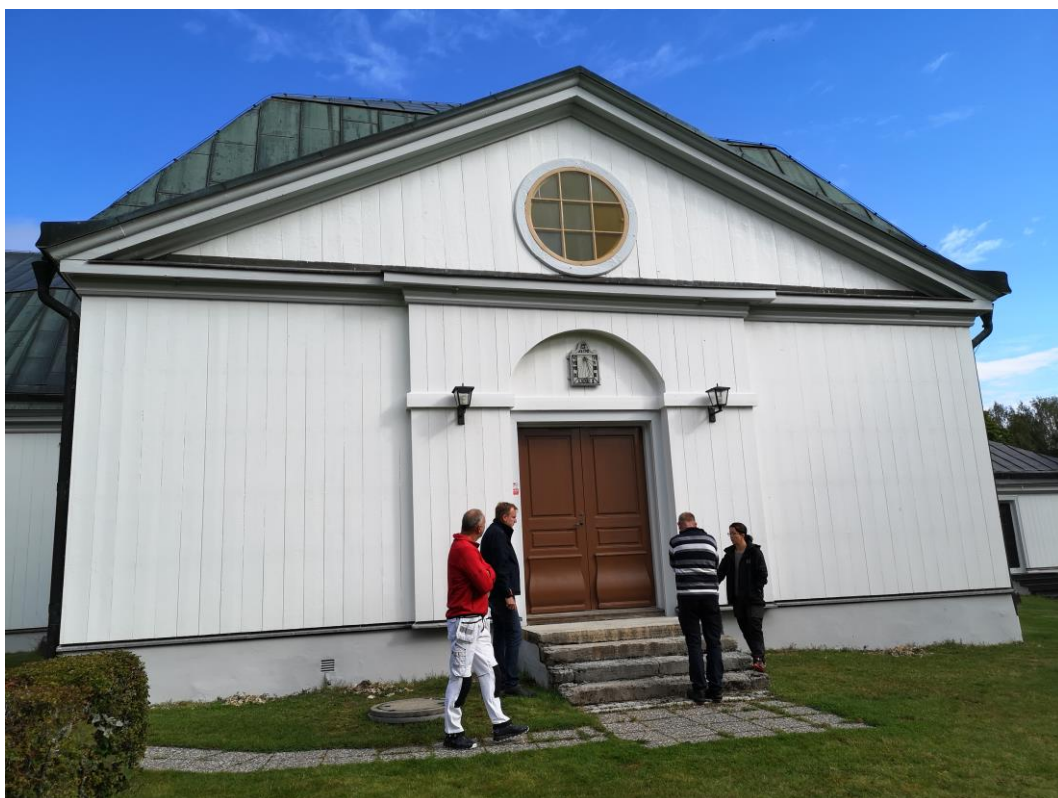
Entrépartiet i södra korsarmen av Järnboås kyrka efter målningsarbeten.