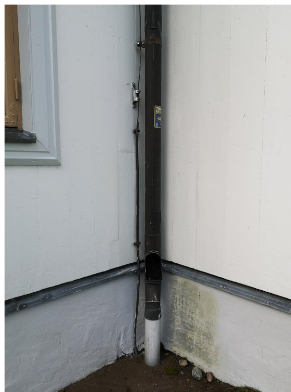
Tornet efter arbeten samt hörnet där det fanns en rötskada bakom stupröret och en liten bit av panelen ersattes.