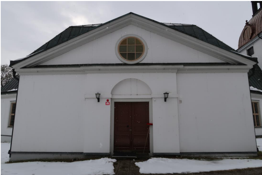
Norra fasaden och korsarmen för åtgärder.