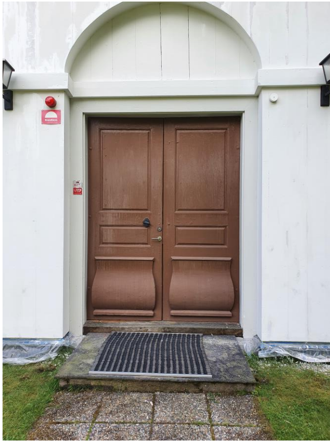
Ena kyrkporten före åtgärder. Färgen har på vissa ställen börjat flaga.