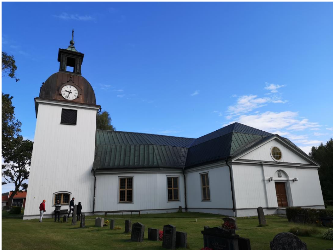
Järnboås kyrka, södra sidan, efter målning.

var lite liten. Där gjordes bedömningen att församlingen ska be plåtslagare titta på takplåt och vattenavledning för att se vilka eventuella åtgärder som behövs.