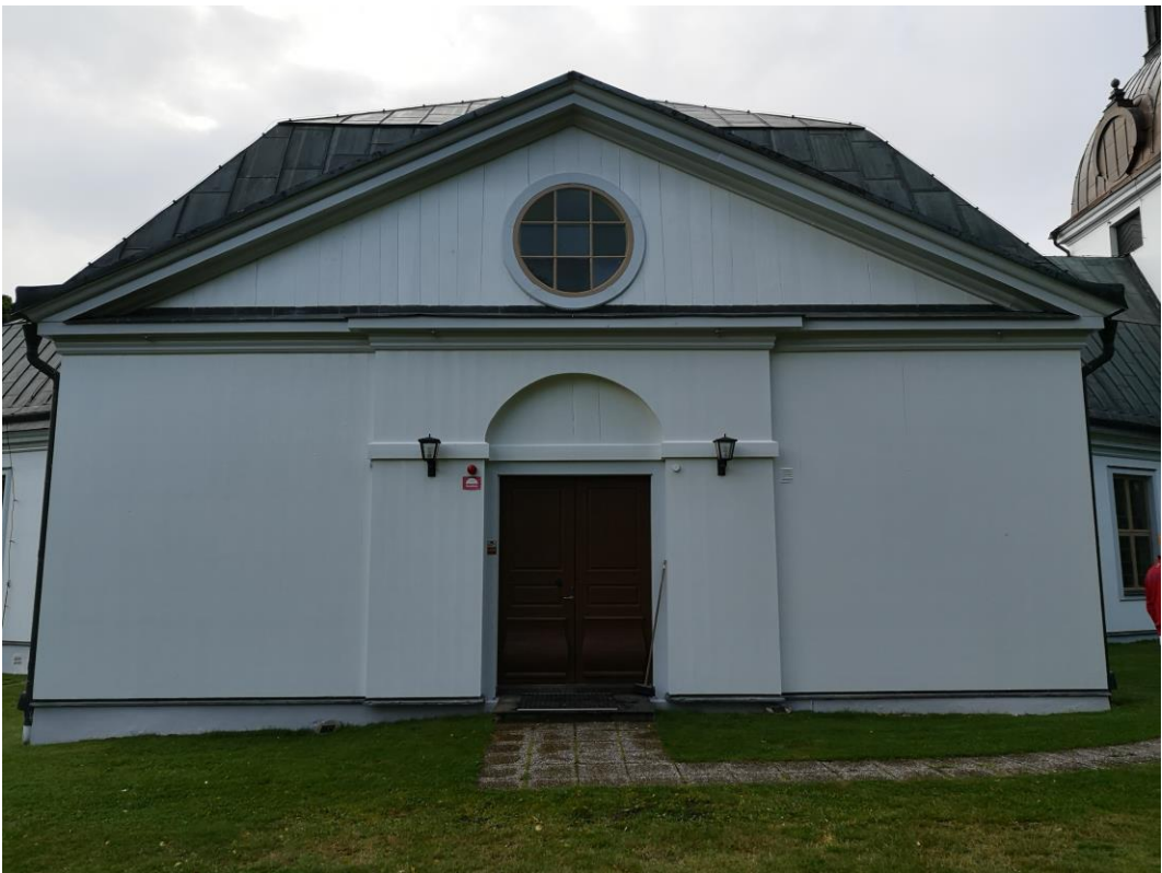
Norra entrén och korsarmen efter målningsarbeten.