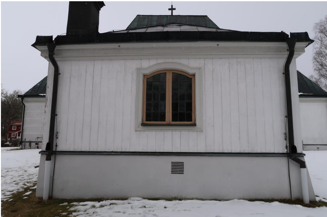
Gamla sakristians östra fasad.