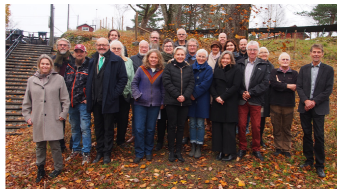
IS 70 år.

høsten ved to av de store museene. Videre greide vi å gjennomføre våre tradisjonsrike og populære førjulsarrangementer med unntak av Julemesse på Haldenvassdragets Kanalmuseum. Årets Pepperkakeby hadde flere åpningsdager i 2021 enn i 2020, og utstillingen og museumsbutikken hadde godt besøk.