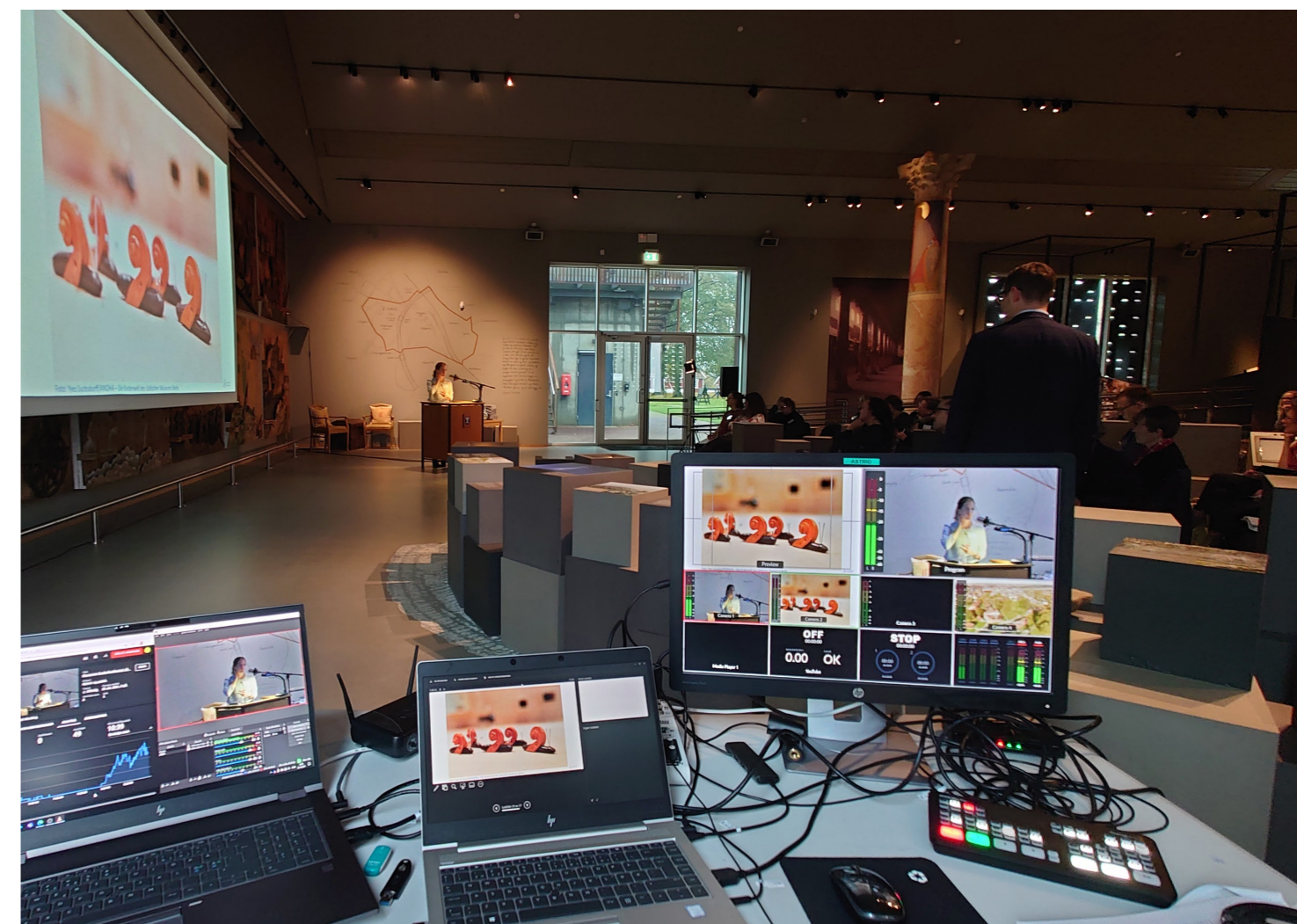
Museenes forskerkonferanse 2021 på Borgarsyssel Museum.

Forskningskompetansen i Østfoldmuseene skal styrkes. Målet er nedfelt i forskningsplanen fra 2017. Arbeidet med revisjon av forskningsplanen ble påbegynt siste kvartal 2021, men museet vil bruke 2022 til å ferdigstille ny plan for FoU og nettverks-