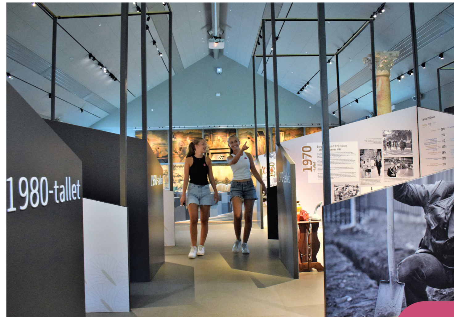
Jubileumsutstillingen «Sarpe Diem – 100 år med museum og folk», i Olavs hall på Borgarsyssel Museum.

Østfoldmuseene har spilt inn til høringen knyttet til planprogrammet og har forventninger om å kunne få bidra i det videre arbeidet med implementering av regionale planer for utvikling, og derigjennom etablere oss som tydelig bidragsyter til stedsutvikling og lokal forankring av de overordnede planene.