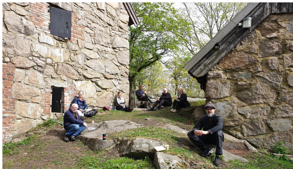
Dugnad på Kongsten Fort.