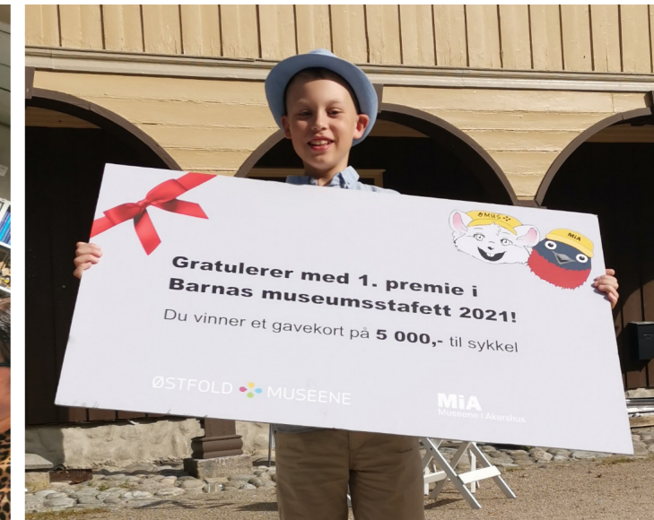
Vinner av Barnas Museumsstafett.

Utstillingen bygger på Luca Bertis fotografiske reise i 2020. På sykkel og med sitt analoge Linhof-kamera, foretok Berti en etnografisk og kunstnerisk fotodokumentasjon av mennesker, arkitektur og kulturlandskap i Indre Østfold.