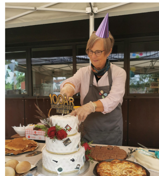
Kakefest på Borgarsyssel Museum i forbindelse med museets hundreårsjubileum i 2021.

Grunnet covid og smittevern hensyn, ble det mindre samarbeid med frivilligheten rundt Ørje Brug knyttet til faste årlige arrangementer som Slusefestivalen, Sootspelet og Julemesse ved Haldenvassdragets kanalmuseum. Østfoldmuseene har likevel hatt samarbeid med Kanalselskapet, turistkontoret og lokale