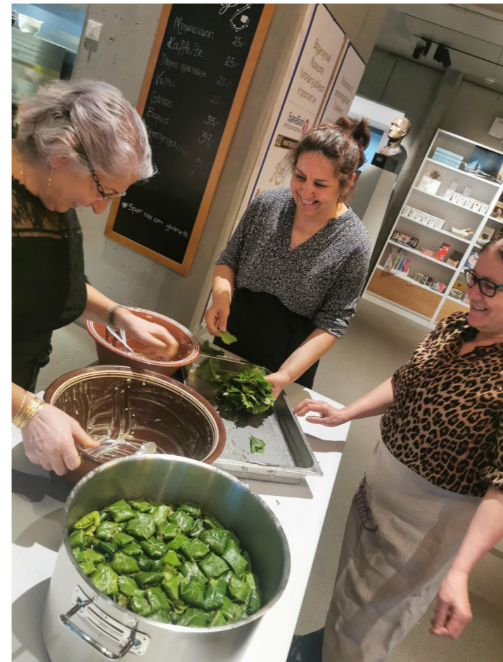
Cafe UMaMI på Borgarsyssel Museum.

Ved Kanalmuseet har vi bistått Utmarksavdelingen med