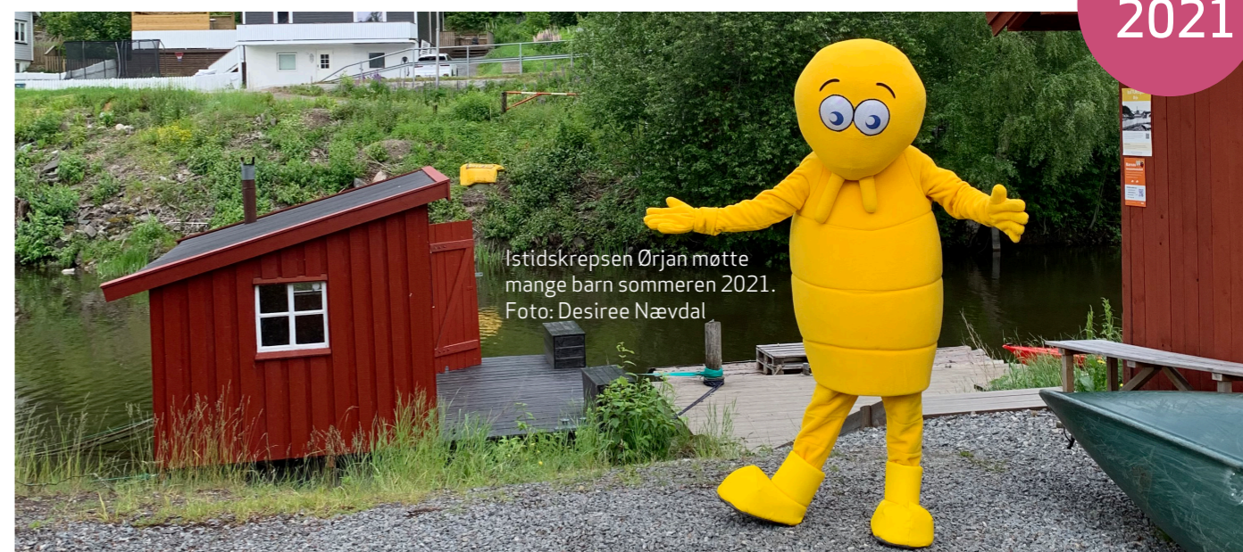
Istidskrepsen Ørjan møtte mange barn sommeren 2021.

aktører om «publikumsslusing», de fleste lørdagene gjennom sommersesongen.