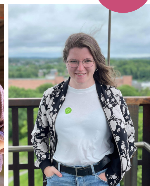
Den magiske følelsen av å kjenne vinden bruse gjennom håret fra det 30 meter høye tårnet på Borgarsyssel Museum.