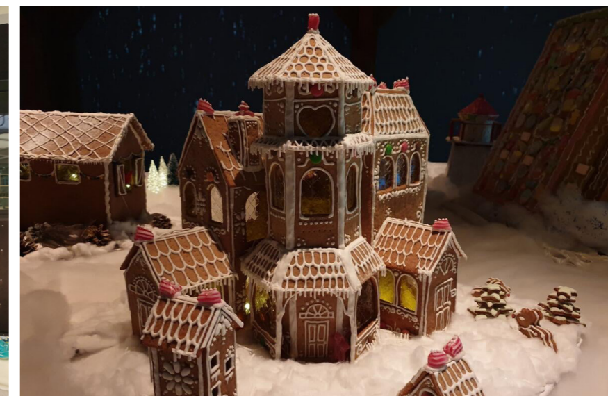
Vinneren av Hvaler & Fredrikstad Pepperkakeby.