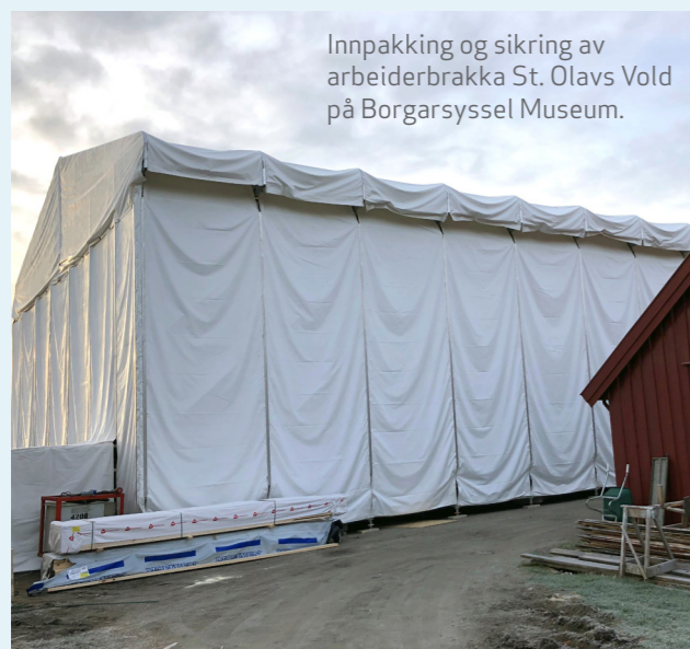
Innpakking og sikring av arbeiderbrakka St. Olavs Vold på Borgarsyssel Museum.

UMaMI – popup-cafe med vekt på flerkulturelle kulinariske