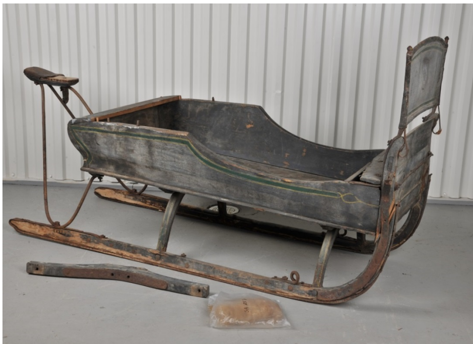
Slede fra Sandefjord Bymuseums samlinger.

Vogner og skyssinnretninger, som landauer, kjerrer og flere flott dekorerte sleder, dessuten brannvogn og ambulansvogn. Slottsfjellsmuseet har også en større samling hesteutstyr; sadler og seletøy, bogtrær og høvrer. I samlingen ved Sandefjord Bymuseum finnes landauer, kjerre, brannvogn og en ambulansvogn. Sandefjord Bymuseum har også en samling hesteutstyr; sadel og seletøy, bogtrær og høvrer.