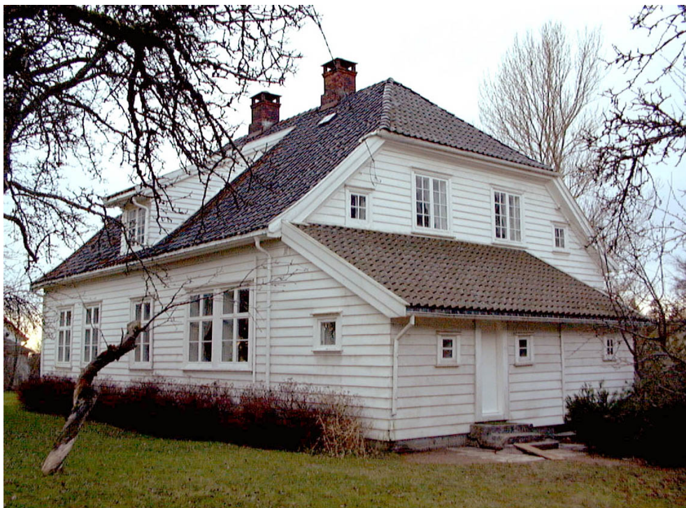
Hovedbygningen, Gumserød gård.

Gården ligger i Brunlanes kommune og ble gitt til Vestfold Fylkesmuseum som en testamentarisk gave i 1978. Anlegget består av et tun omkranset av en herskkelig hovedbygning fra ca 1820, forpakterbolig fra omtrent samme tid, gammelt stabbur samt låvebygningen. Dagens låvebygning ble oppført etter at den gamle låven fra 1914 brant. Hovedbygningen er omkranset av en blomster- og frukthage. Våningshusets interiør er fra tidlig 1800-tall og fram til 1970-årene. Gumserød ble trolig ryddet i høymiddelalderen og var lenge en del av Tanum kirkes gods. Bygselen på gården ble i 1813 overtatt av garnisonsprest i Fredriksvern, senere stortingsmann.