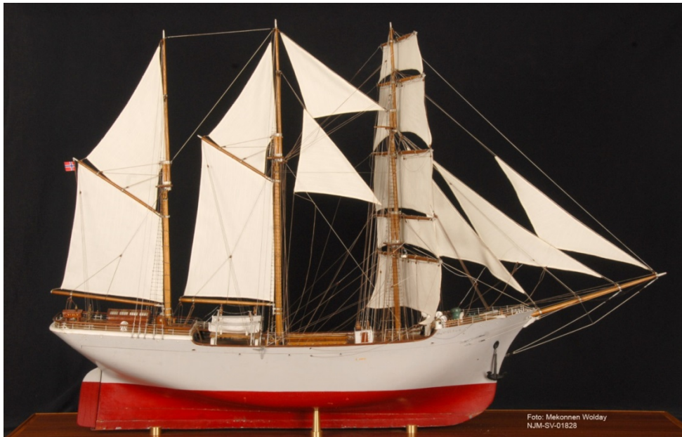
Skutemodell i Svelvik Museums samlinger.

Sandefjord Sjøfartsmuseums samlinger av skip består av skipsmodeller, flåtemodeller og halvmodeller (i størrelsesorden 150) i hovedsak fra perioden 1800-1950, samt noe skipsutstyr (både fast og løst) og noen personlige eiendeler.