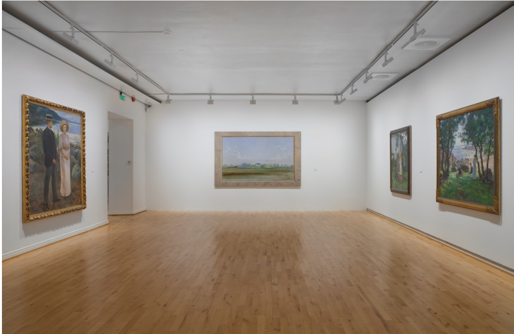
Malerier fra samlingen ved fra Haugar Vestfold kunstmuseum.