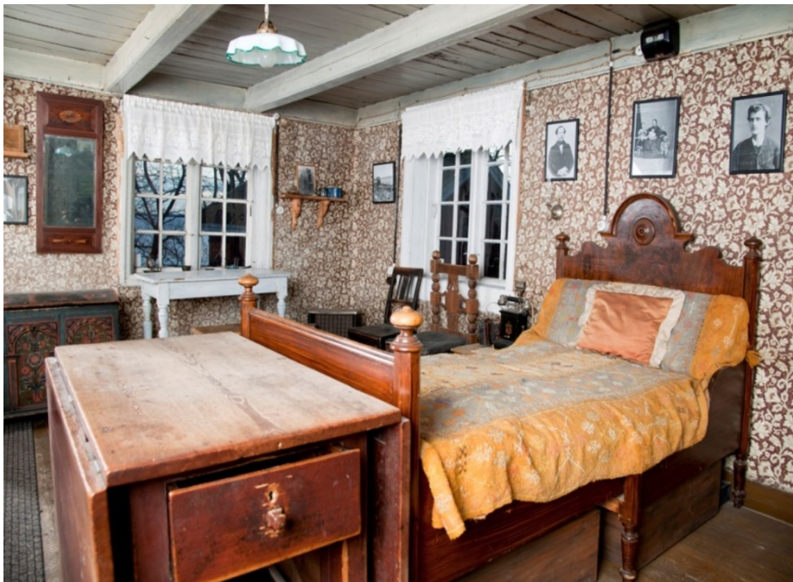
Interiør fra maleren Edvard Munchs hus i Åsgårdstrand.