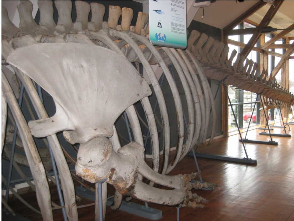
Hvalskjelett fra Den arktiske avdeling ved Tønsberg Museum.