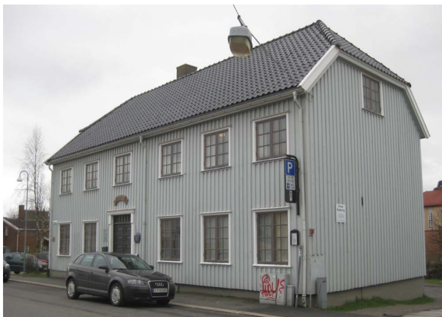
Tidligere Sandefjord sjøfartsmuseum, Prinsensgate, Sandefjord.