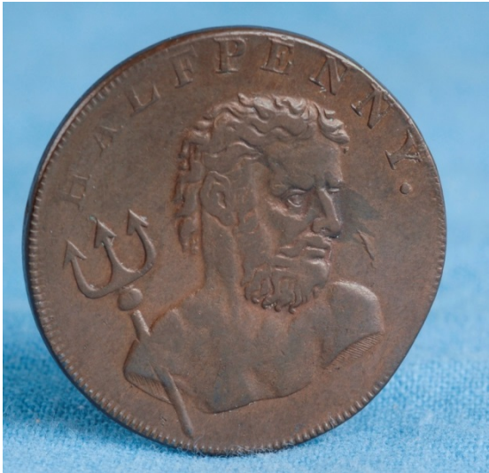
Halfpenny fra Hvalfangstmuseets samlinger.

Numismatiske samlinger består av medaljer, mynter og pengesedler, norske og utenlandske, antikke og moderne. Antall registrerte mynter totalt er i størrelsesorden 850 objekter. Samlingen inneholder også rundt 150 medaljer. De fleste medaljene er ulike typer stevne-medaljer av nyere dato.