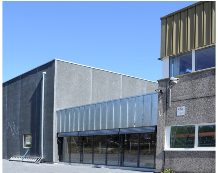
Vestfoldarkivet, Hinderveien 10, Sandefjord.

distriktshøgskolene og statsarkivene – og til fylkeskommunene spesielt.