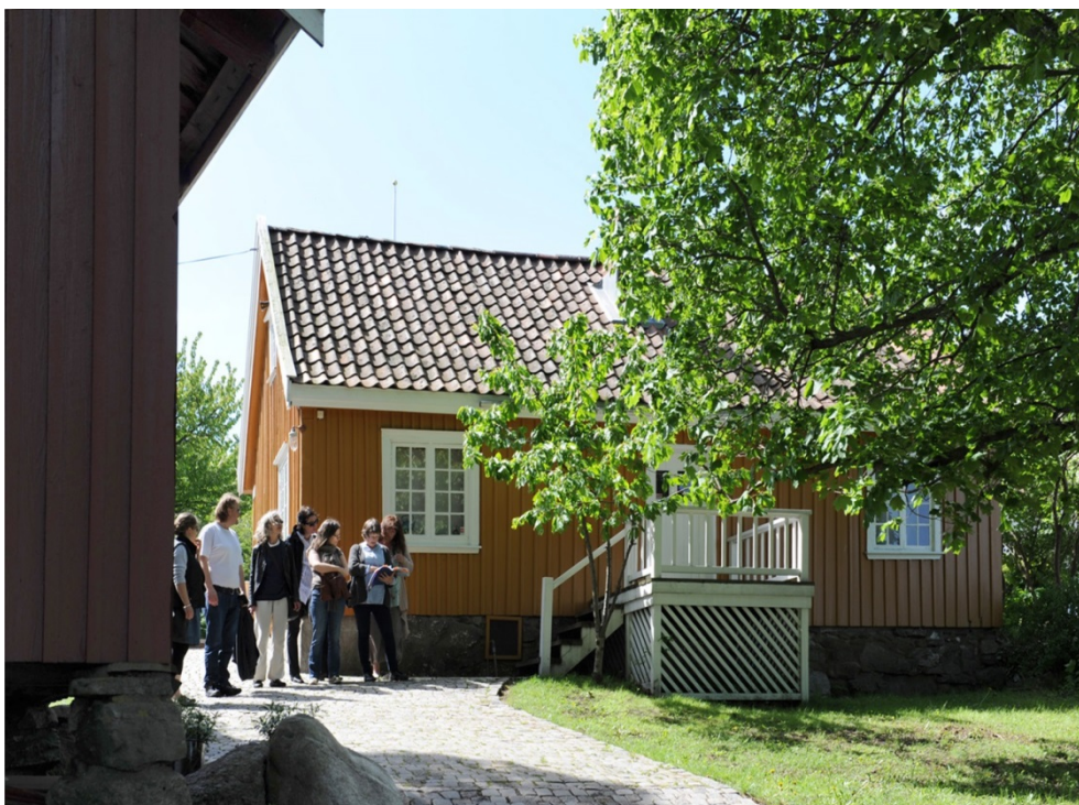
Maleren Edvard Munchs hus, Åsgårdstrand.

Anlegget består av 3 bygninger, Edvard Munchs sommerhus, atelier og avtrede. Bygningene er frittstående, beliggende i en stor park. Gaten som eiendommen ligger i, het opprinnelig Nygaards-gaten. Etter kunstnerens død ble gaten omdøpt til Edvard Munchs gate til minne om han. I likhet med mange andre bolighus i nordre del av Åsgårdstrand lå Edvard Munchs eiendom på gården Nygårds grunn. Tomten var bygslet, og Munch måtte betale en årlig bygselsavgift. Bolighusets alder er ukjent, men kan dokumenteres tilbake til 1830 gjennom en såkalt grunnseddel, men er antakelig eldre. De eldste bygningsdelene er i empirestil, noe som kan tilsa at huset er bygd en gang mellom 1810 og 1830.