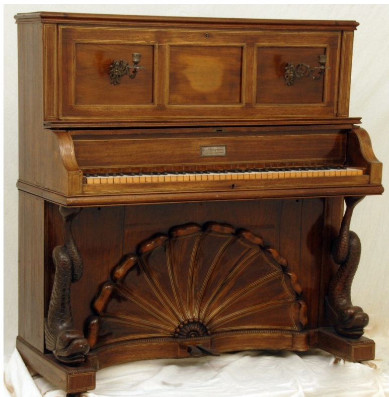
Piano fra Larvik Museums samlinger.

Det finnes en rekke ulike musikkinstrumenter i samlingen. De grupperer seg likevel i hovedgrupper; tangentinstrumenter, særlig pianoer og korpsinstrumenter fra Berger Musikkforening. Slottsfjells-museets Cembalo står i en særklasse. Larvik har 11 piano i samlingen hvorav 2 er av Larviks egen pianomaker Jens Hoff, i tillegg finnes harpe, langeleik og fioliner. Berger Musikkforening ble stiftet i 1884. Berger Fabrikker, Jens J. Jebsen & Co. A/S holdt instrumenter, og var korpsets trofaste støtte. Flere av de gamle messing-instrumentene er i dag overført til magasinet. Samlingen av inneholder også piano, klaver, husorgel og en harpe, foruten mindre instrumenter som fiolin, tromme, citer og munnspeil.