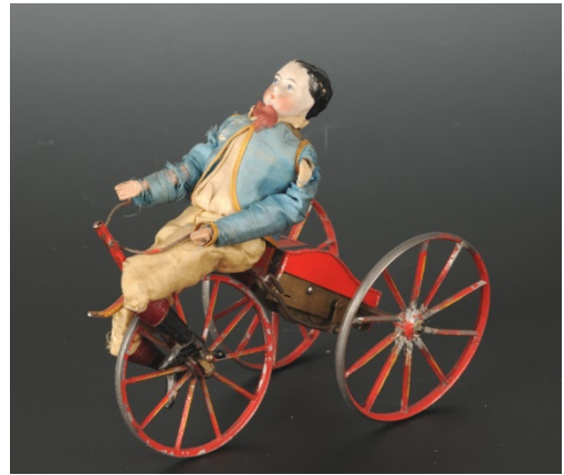
Leketøy fra Larvik Museums samlinger.

Samlingen av leketøy er på rundt 150 objekter og består av leker fra ulike tidsaldre. Den inneholder alt fra Las Palmas-dukke og dukkeutstyr (fra begynnelsen av 1800-tallet til 1950-årene) til dukkestuer med utstyr, lekebiler, lekehest og diverse spill som brettspill og pinnspill. Dessuten kjelker, ski og skøyter.