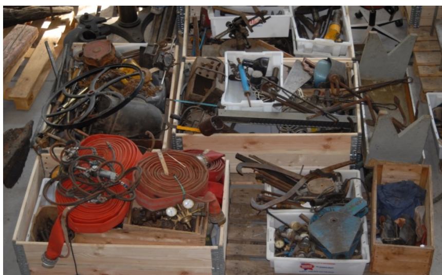
Gjenstander samlet inn i regi av Prosjekt Verft.

Skipsbygging i Vestfold var en hjørnestein i næringslivet i fylket. I løpet av noen år på 1980-tallet ble store virksomheter nedlagt i Sandefjord (Framnæs mekaniske Værksted) Tønsberg (Kaldnes) og Horten (Horten Verft). Museene i Vestfold, Høgskolen i Vestfold sammen med Vestfold fylkeskommune startet da en bergingsaksjon med sikte på å bevare gjenstander, arkiv og fotomateriale. En omfattende fotodokumentasjon og en del intervjuer ble også gjort.