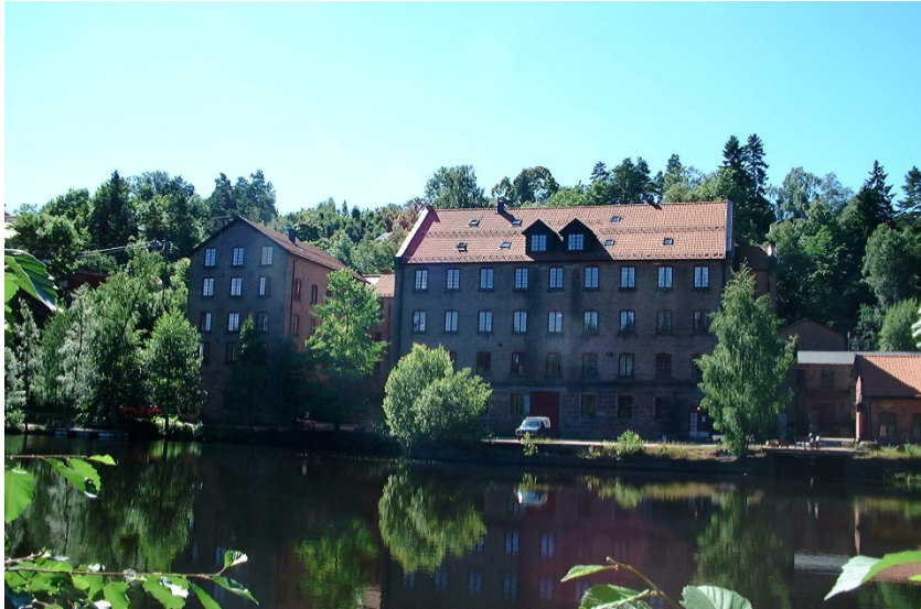
Fossekleiva Kultursenter, tidligere Fossekleven fabrikk.