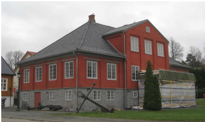
Kirkestredet 5, Larvik sjøfartsmuseum.

Larvik Sjøfartsmuseum disponerte lokalene til museal virksomhet siden 1962. Den eies av Larvik kommune og Larvik kommunale eiendom har det bygningsmessige ansvaret for anlegget, mens Larvik Museum disponerer bygningen til museale formål. Utstillingene ble i 2011 tatt ned på grunn av den utvendige restaureringen som også påvirket inneklimateet for gjenstandene i stor grad. Bygningen blir i løpet av 2014 ferdig restaurert utvendig.