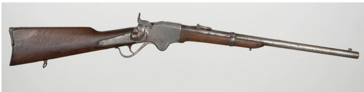
Gevær fra Larv Museums samlinger.

Det finnes en rekke ulike typer våpen i samlingen, som sabler, dolker, kniver og skytevåpen og noen krutthorn. I Slottsfjellsmuseets samling finnes en rekke geværer, de fleste fra 1800-tallet. I samlingen til Larvik Museum finnes pistoler og diverse stikkvåpen som kårder, sabler, dolker og sverd i tillegg til krutthorn og kanonkuler. Sandefjord Bymuseum og Hvalfangst-museet har i sine samlinger både gevær, pistoler, bajonett, pallask, sabel, jaktkniv samt tilbehør som kuler, patronhylse, krutt.