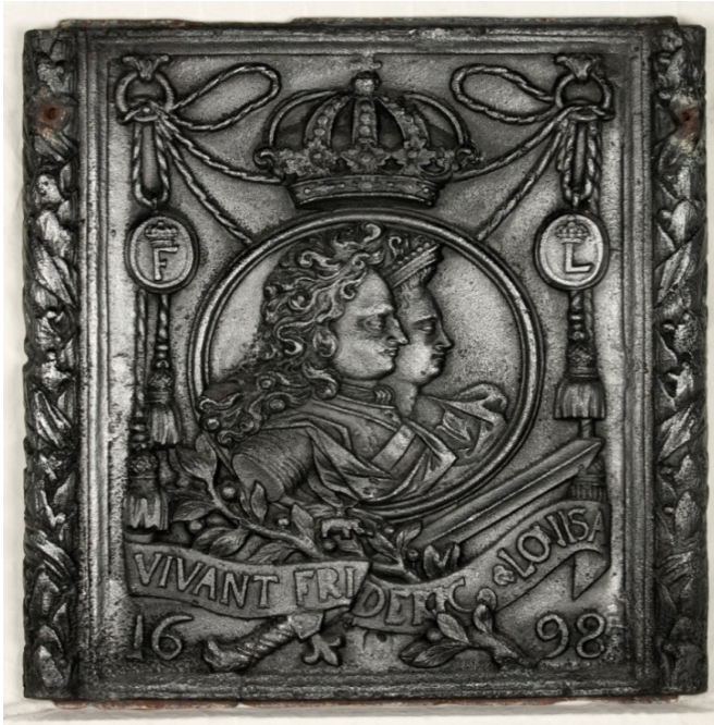
Ovnsplate fra Larvik museums samlinger.

I samlingen til Slottsfjellmuseet, Larvik Museum og Treschow Fritzøe museum er det bevart eksempler fra produksjonen fra begge jernverkene. I samlingen inngår 103 ovnsplater fra ulike jernverk, men hovedtyngden er fra Fritzøe Verk med Eidsfoss 11 og Hassel som en god nummer to. I samlingen inngår også flere hele Fritzøeovner og ovner fra andre jernverk.