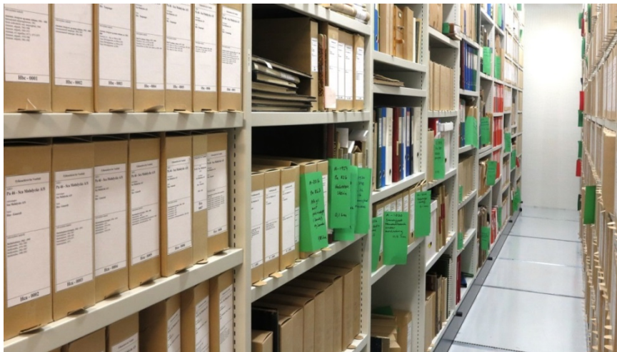
Vestfoldarkivets magasin.

Organisasjonsarkivene dominerer i antall, og dokumenterer bredt frivillig sektor i fylket. Materialet består av arkiver etter sosiale og humanitære organisasjoner, feltene kultur, sport og musikk, arkiver etter interesseorganisasjoner som for eksempel Vestfold Handicapklubb og Foreningen for homofil og lesbisk frigjøring i Vestfold og Vestfold Krigsseilerforening. Videre består samlingen av arkiver etter politiske partier, fagforeninger, losjer og avholdslag.