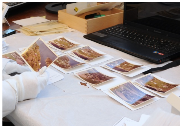
Arbeid med Widerøe samlingen.

Nasjonalbiblioteket for optimale lagringsforhold samt digitalisering.