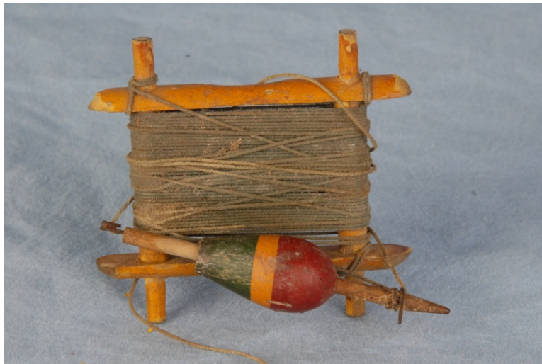
Vindsel, Hvalfangstmuseet.

Landbrukssamlinger finnes også i stort omfang i de lokale historielagenes samlinger. Størst er sannsynligvis Sande historielags bygdesamlinger som er utstilt i låven på gamle Sande prestegård. Det er særlig redskaper og maskiner fra jord- og skogbruk som er samlet inn, og disse gir et bilde av utviklingen fra hestetid og inn i maskinalder . Her finnes treskeverk, høyvogner, slåmaskiner m.m. Hedrum historielag, Tjølling historielag og Brunlanes historielag har også egne samlinger av landbruksredskap, likeså Reidvintunet i Hillestad. Stokke bygdetun har også en omfattende landbruks-samling.