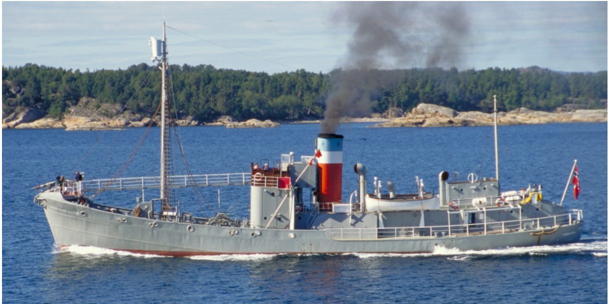
Hvalbåten Southern Actor.

Viktig i samlingen er hvalbåten Southern Actor. Denne gir innblikk i arbeidsliv og sosialt fellesskap på en moderne hvalbåt.