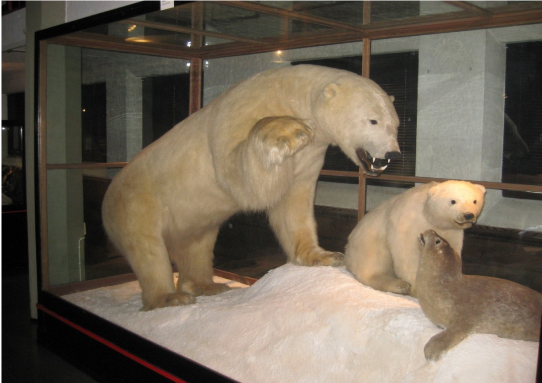
Isbjørn og sel i moter, Hvalfangstmuseet.

Samlingen omfatter også et stort antall utstoppede fugler fra Antarktis og Arktis, så som albatross, petrell, slirenebb, pingvin, sørhavsjo, polarmåke, lunde, polarlomvi, havhest, rødnebbterne. De har sine naturlige habitater i arktisk og antarktisk, men er ervervet til samlingene for å belyse hval- og selfangsten i disse områdene.