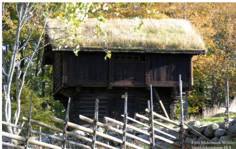
Heierstadloftet på Vestfoldtunet.

Friluftsavdelingen (Vestfoldtunet) på Slottsfjellet består av 14 hus som danner et tilnærmet åpent firkanttun for å illudere en typisk Vestfold-gård. Det er to framhus på tunet. Det eldste, Hynnestua (datert til 1685), kommer fra Hynne i Andebu. Huset sto på Andebu bygdemuseum på Berg og ble gjenreist på Tallak i 1958. Det andre framhuset er Vålehuset fra ca 1795 fra Hem søndre, Våle i Undrumsdal. Det ble først gjenreist som museumshus på Mellom-Teglhagen, men flyttet til Tallak i 1947. Låven, Bøenlåven fra 1820-årene, kommer fra Bøen i Andebu. Stabburet er et kåpebur som er særegent for Vestfold fra Fadum i Sem og er fra ca 1820-40. De ble begge satt opp i 1952. Litt på siden av tunet står middelalderloftet fra 1406-07. Heierstadloftet (datert til 1405-7) fra Heierstad i Hof, kjøpt og gjenreist på Vestfoldtunet i 1957.