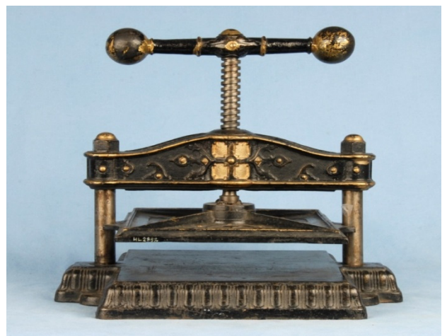
Presse fra Larvik museums samlinger.

Håndverksamlinger består av redskaper og gjenstander fra ulike typer verksteder. I Slottsfjellmuseets samling finnes gjenstander fra flere snekkerverksteder samt smieutstyr etter smia på Fevang og tønnefabrikken på Sem. Foruten disse har museet redskaper etter tømmer, salmaker, bokbinder, fotograf og fra et trykkeri. I samlingene til Hvalfangstmuseet, Bymuseet og Sjøfartsmuseet i Sandefjord finnes en rekke redskap fra et stort antall håndverk, som blant annet snekker, tømmer, slakter, seilmaker, repsluger, smed, bøkker, fotograf, salmaker, skomaker, hjulmaker, modellmaker, trykker og sømmerske. I samlingene til Larvik Museum (Sjøfartsmuseet) finnes tømmermannskister fra båtene og hjulmakerverksted. Det finnes på den annen side lite redskap fra den håndverksbaserte jernproduksjonen, men tremodeller og treplater er bevart.