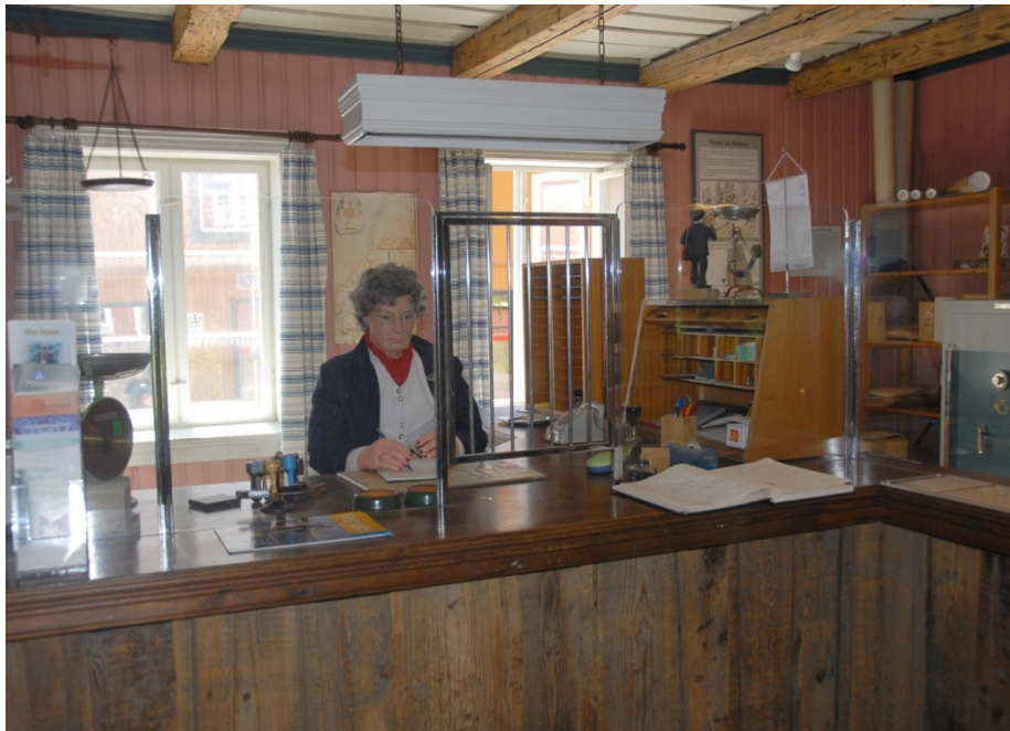
Postkontormuseet på Eidsfoss. Foto. Mekonnen Wolday.