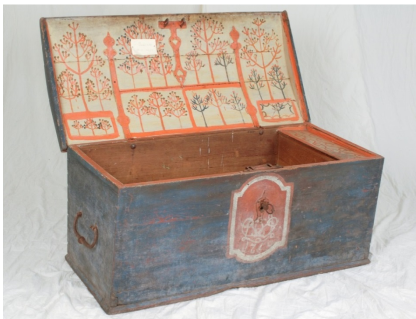
Kiste fra Slottsfjellsmuseets samlinger.

Til folkekunst regnes gjerne malt dekor, rosemaling . Denne karakteriserer folkekunstens blomstringsperiode. I Vestfold-sammenheng er spesielt Andeburosa et kjent motiv. I treskurden finnes det en gruppe geometriske motiver som har stor utbredelse; de bygger på sirkelen som utfylles med forskjellige mønstre og forekommer særlig i karveskurd.