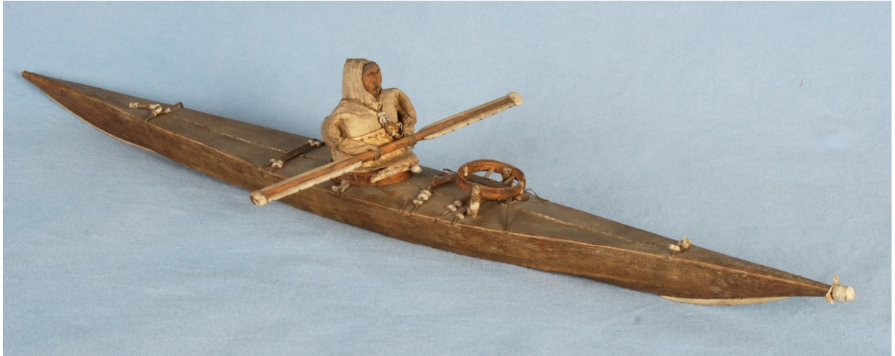
Modell av inuittkajakk, Hvalfangstmuseet.

I Larvik Sjøfartsmuseums samlinger finnes et mindre antall gjenstander tatt hjem som suvenirer fra Syd-havet . En enmannsflåte fra Peru og 3 spydspisser i stein fra Påskeøya gitt av Thor Heyerdahl.