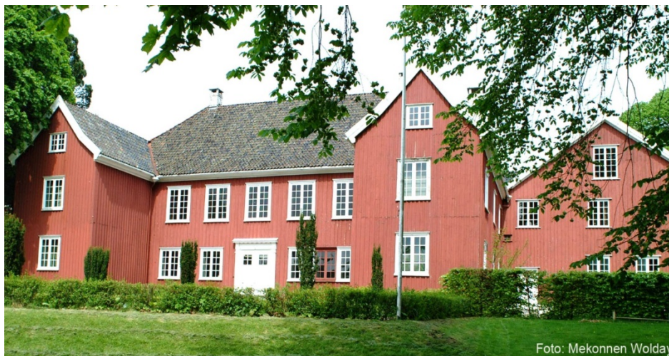
Herregården i Larvik.

Herregården i Larvik ble fredet i 1923, men alt i 1917 omtalte riksantikvar Fett bygningen som et «uvurderlig monument» av «godseiertypen i Vestfold». 9 Den ble bygget som residens for stattholder og greve Ulrik Frederik Gyldenløve i 1677. Bygningen er en barokk trebygning med interiører i barokk og régence. Herregården var i bruk som grevelig residens i perioden 1677-1805 og var deretter i privat eie fram til bygningen ble kjøpt av kommunen i 1821. Herregården har siden da vært brukt som byens rådhus, teater, skole, bibliotek, rektorbolig, vaktmesterbolig og prestebolig. Anlegget eies av Larvik kommune og Larvik Museum disponerer bygningen til museale formål.