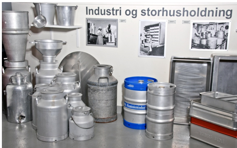
Aluminiumprodukter fra Høyang.

Aluminiummuseet viser etableringen og utviklingen av norsk videreforedlingsindustri av aluminium i Holmestrand og Norge. Samlingen inneholder derfor både en bedriftshistorie, arbeidslivshistorie, designhistorie og produksjonshistorie til pionerbedriften A/S Nordisk Aluminiumindustri, senere ÅSV og Hydro Aluminium Holmestrand. Kjøkkentøyet med merkenavnet Høyang er utviklet i Holmestrand og størsteparten av gjenstandssamlingen består av Høyang-produkter.