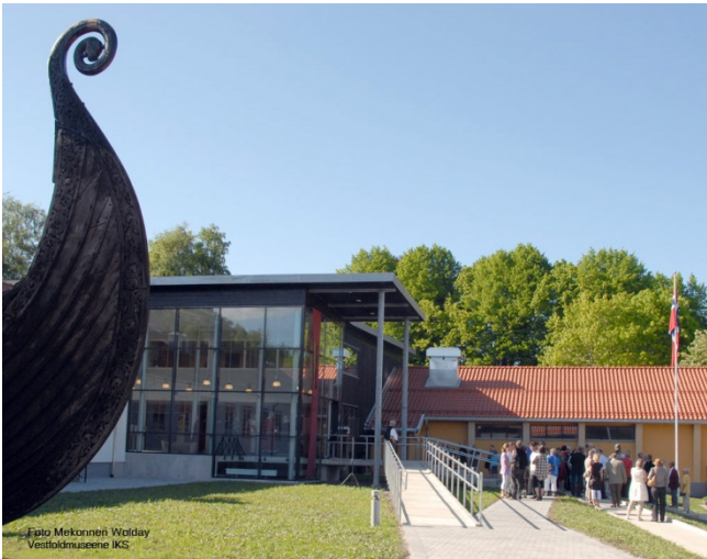
Slottsfjellsmuseet, tidligere Vestfold fylkesmuseum.

Vestfold Fylkesmuseum er det nærmeste man kommer et folke- og friluftsmuseum i Vestfold. Fylkesmuseet hadde en forankring i det gamle Tønsberg Museums samlinger, men ambisjonen for det nye museet var langt større og omfattende. Initiativ til et fylkesmuseum for Vestfold ble tatt av Vestfold historielag allerede i 1927. Tanken om et fylkesmuseum for med både kulturhistorisk avdeling og en friluftsavdeling var i tråd med både samtidens museumstanker. Initiativtakere til det nye fylkesmuseet er å finne i Vestfold historielag, Vestfold Ungdomsfylking, Tønsberg Sjøfartforening. I sin begrunnelse for det nye museet ble det påpekt at det var eiendommelig at Vestfold lå så langt tilbake i museumsutvikling i forhold til landet for øvrig. Vestfold med sin rike historie,