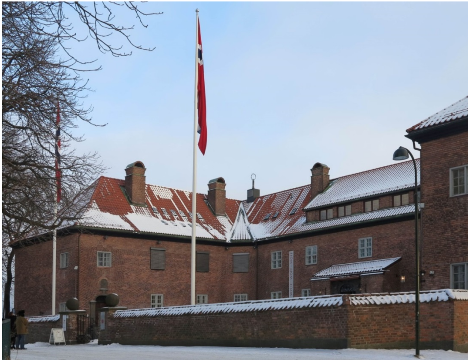
Haugar Vestfold kunstmuseum.