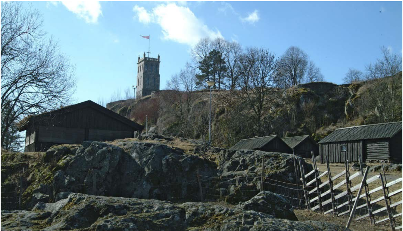
Slottsfjellet i Tønsberg med Slottsfjellstårnet.

I Tønsberg står Slottsfjellet med Tunsberghus festning (Castrum Tunsbergis) og Mikaelkirken i en særstilling står for ettertiden som minnested over Kong Sverre, birkebeinerne, Håkon Håkonsønn og Magnus Lagabøte.