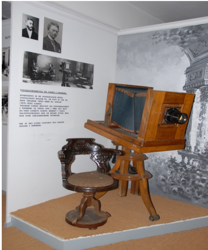
Fotograf Th. Larsens atelier, utstillingsfotografi.

Fotografi har tradisjonelt ikke utgjort en egen samlingskategori i de i kulturhistoriske museene. Fotografi i museer og arkivinstusjoner betegnes gjerne som kulturhistorisk fotografi og ved det forstås funksjonsmotivert bruksfotografi bevart som historiske dokumenter og kildemateriale. Samlingene inkluderer også noe fotografi fremstilt for eksempel i naturvitenskapelig eller kommersiell sammenheng, dessuten ulike former for dokumentasjonsfotografi.