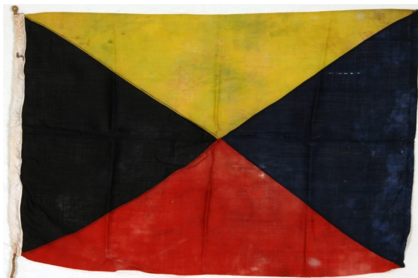
Signalflegg fra Hvalfangstmuseets samlinger.

Hvalfangstmuseet og Sjøfartsmuseets samlinger inneholder blant annet nasjonalflagg, unionsflagg, splittflagg, rederiflagg, hvalflagg (markeringsflagg) og maritime signalflegg, tåkelurer m.m.