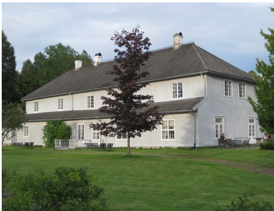
Hovedgården, Eidsfoss Verk.