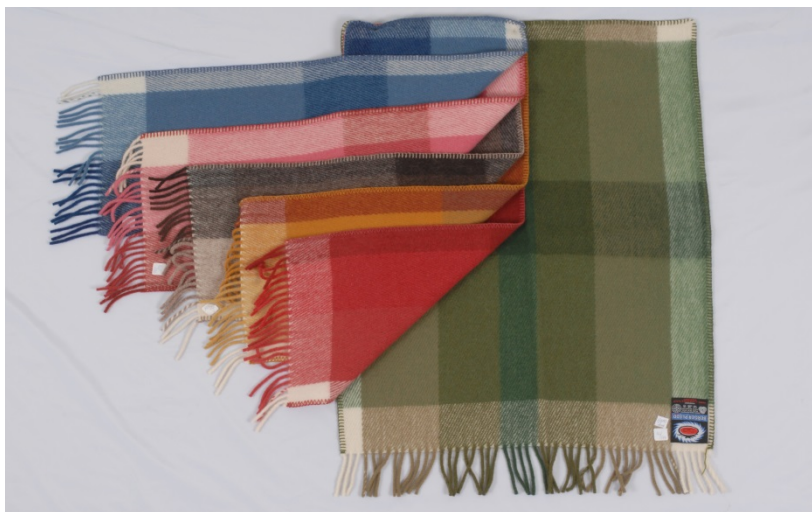
Bergerpledd fra Berger Museums samlinger.

sjonslinjen spesielt når det gjelder jacquardvevde tekstiler. På dette området var tekstilindustrien på Berger ledende i norsk og europeisk sammenheng.