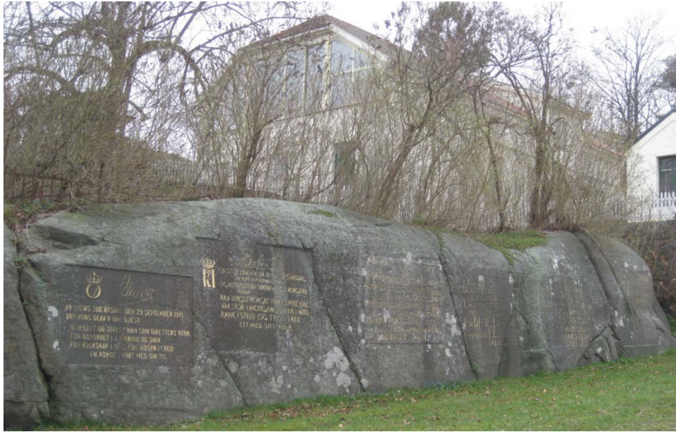
Inskripsjonene i fjellet ved Herregården i Larvik.