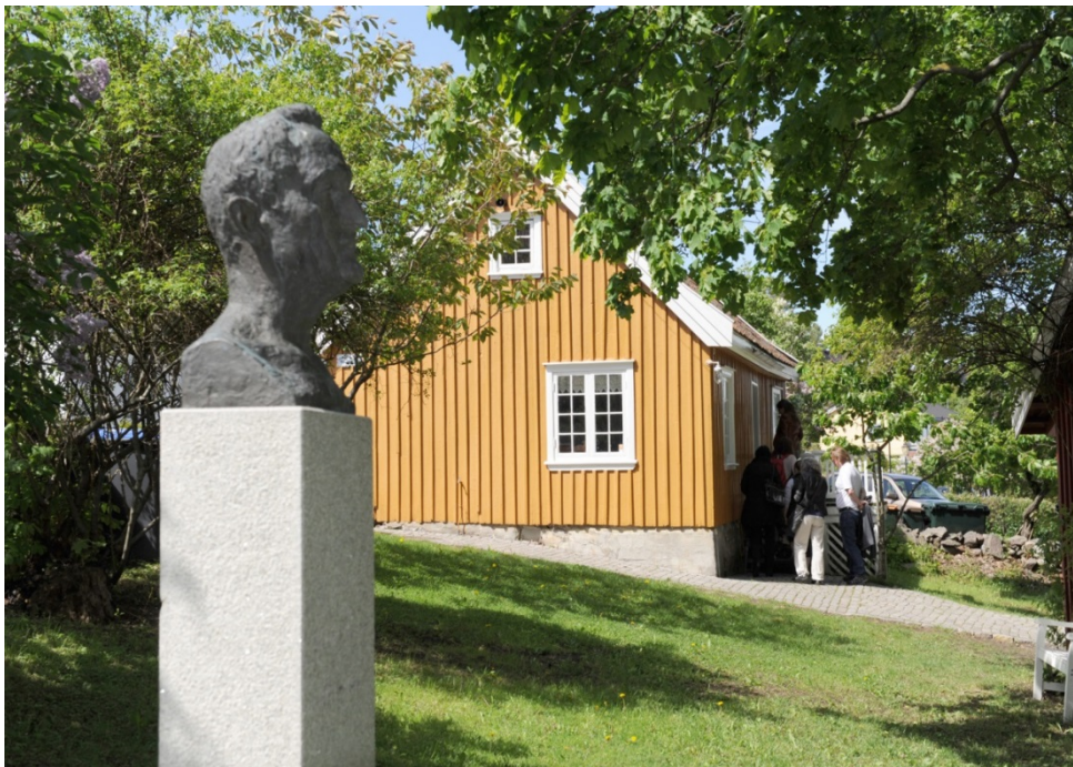
Maleren Edvard Munchs hus, Åsgårdstrand.

Munchs Hus (Edvard Munchsgate 25) var malerens sommerhus i Åsgårdstrand fra 1897. Huset forble i Munchs eie frem til hans død i 1944. Daværende Åsgårdstrand kommune kjøpte eiendommen, og etter en omfattende restaurering og utvidelse av den opprinnelige hagen åpnet huset som museum allerede i 1947. Munchs søster Inger sørget for å tilbakeføre gjenstander som i mellomtiden var blitt fjernet. Museet består av 3 bygninger, Edvard Munchs sommerhus, atelier og avtrede. Bygningene er frittstående, beliggende i en stor park. Hovedhuset kan dokumenteres tilbake til 1830 gjennom en såkalt grunnseddel, men er antakelig eldre. Dagens atelier er en kopi, oppført i 1969/1970.