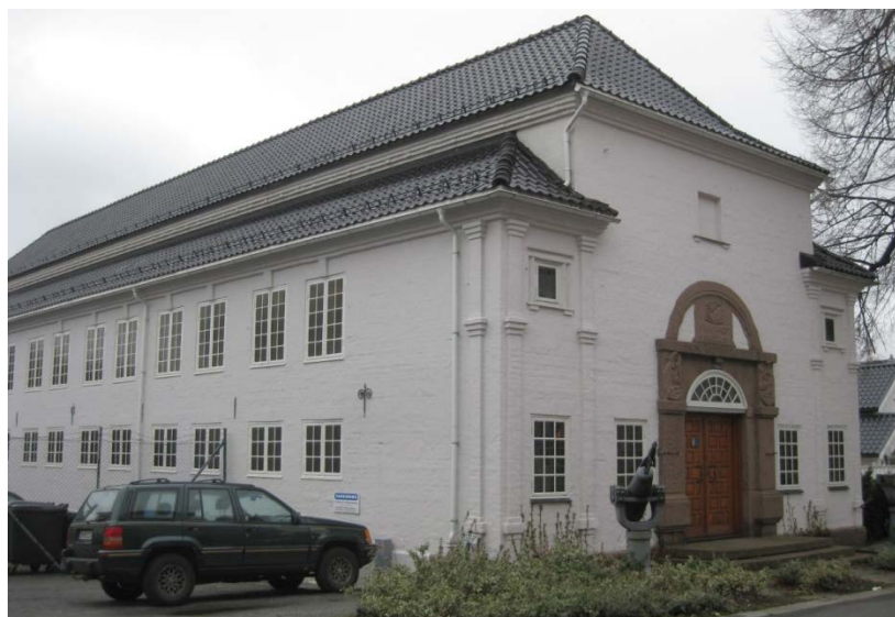
Kommandør Chr. Christensens Hvalfangstmuseum.

Bygningen eies av Sandefjord kommune. Bygningen som huser museet ble fullført i 1917. Museumsbygningen ble tegnet av arkitekt N.W. Grimnæs og utsmykket med skulpturer av billedhuggeren Vigrestad.