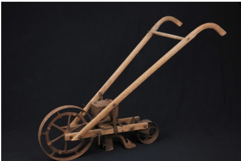
Såmaskin, Hvalfangstmuseet.

Landbrukssamlinger finnes også i stort omfang i de lokale historielagenes samlinger. Størst er sannsynligvis Sande historielags bygdesamlinger som er utstilt i låven på gamle Sande prestegård. Det er særlig redskaper og maskiner fra jord- og skogbruk som er samlet inn, og disse gir et bilde av utviklingen fra hestetid og inn i maskinalder . Her finnes treskeverk, høyvogner, slåmaskiner m.m. Hedrum historielag, Tjølling historielag og Brunlanes historielag har også egne samlinger av landbruksredskap, likeså Reidvintunet i Hillestad. Stokke bygdetun har også en omfattende landbruks-samling.