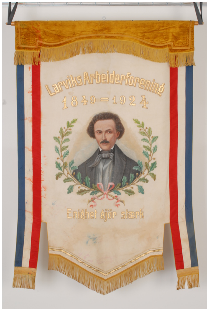
Fane fra Larvik Arbeiderforening.