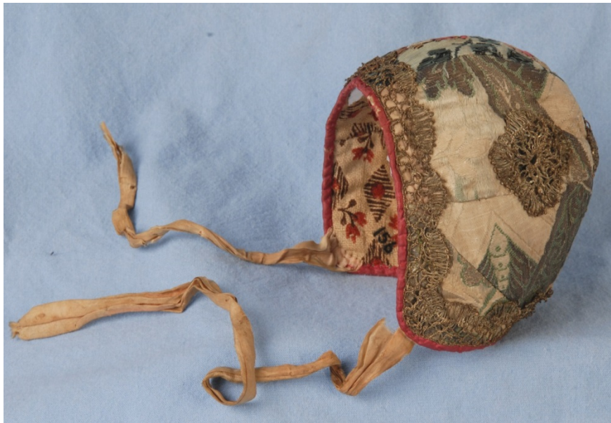
Dåpslue i brosjert silke med sølvkniplinger, 1700-tallet.

Slottsfjellsmuseets samling av tekstiler er den mest omfattende. Storparten av draktsamlingen kommer med enkelte unntak, fra embetsmanns- og bymiljø. Samlingen domineres av drakter fra 1800-tallet, men inneholder også materiale fra 1700-tallet bl.a. kjoler og caper i engelsk og fransk silke fra gårder i Botne og Andebu. Samlingen av dåpsposer i silke er også betydelig. I samlingen inngår også flere navneduker (fra 17- og 1800-tallet), mange broderte bilder, perlearbeider, puter, duker, sengetøy osv. fra 1800- og begynnelsen av 1900-tallet. Det finnes også en stor del tekstilredskap.