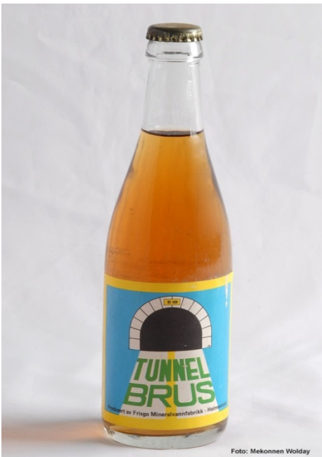
Tunnelbrus fra Frisgo Mineralvannfabrikk, Holmestrand.

Gjenstandsamlingene Vestfoldmuseene forvalter viser et tidsmessig tyngdepunkt fram til mellomkrigstiden. Det finnes en del unntak, men gjennomgående er tiden etter 1950 lite representert. Begrepet samtid har vært tema for mange diskusjoner. Det fins ikke en allment akseptert eller riktig definisjon av begrepet. Det er ofte uhensiktsmessig å definere en bestemt tidsgrense. En vanlig tilnærming er å vurdere hvilke forhold som er sentrale for tiden vi lever i nå, og gå så langt bakover i tid som det er nødvendig for å forstå det man velger å undersøke. Museet kan senere følge fenomenet inn i framtiden, så lenge det er relevant. Samtid blir dermed et relativt begrep avhengig av hvilket tema man dokumenterer.