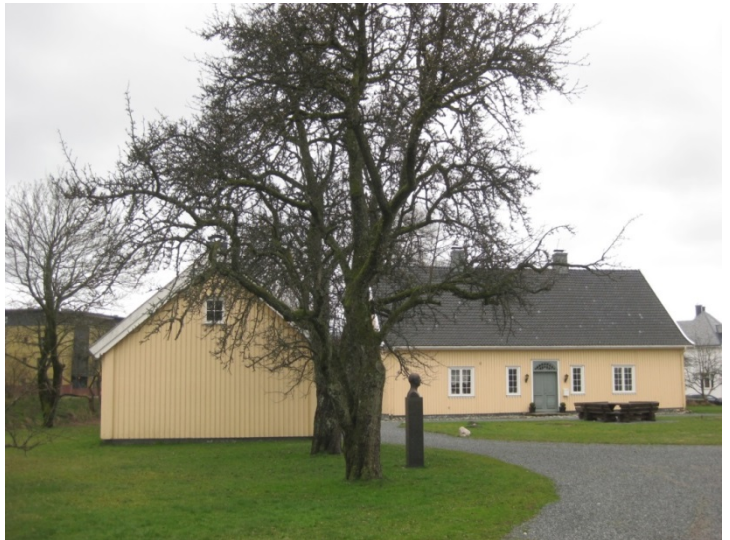
Pukkestad gård, tidligere Sandefjord bymuseum.

Ved bybrannen 1900 mistet Sandefjord Bymuseum sine samlinger. Arbeidet for et nytt bymuseum startet imidlertid opp på ny alt året etter med ny interesse påvirket av den kulturhistoriske utstillingen på Bygdøy 1901. Det nystiftede Sandefjord og Sandar Fortidslag fikk disponere assuransesummen for den første samlingen for å samle inn på nytt. Denne samlingen ble også kommunens eiendom. Fram til 1929, da Fortidslaget ble nedlagt, engasjerte laget seg sterkt i museumsarbeidet. I 1926 fikk samlingen eget lokale, en laftebygning oppført sør for