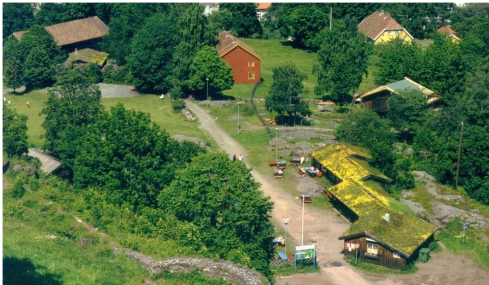
Deler av Vestfoldtunet.

Friluftsavdelingen (Vestfoldtunet) på Slottsfjellet består av 14 hus som danner et tilnærmet åpent firkanttun for å illudere en typisk Vestfold-gård. Det er to framhus på tunet. Det eldste, Hynnestua (datert til 1685), kommer fra Hynne i Andebu. Huset sto på Andebu bygdemuseum på Berg og ble gjenreist på Tallak i 1958. Det andre framhuset er Vålehuset fra ca 1795 fra Hem søndre, Våle i Undrumsdal. Det ble først gjenreist som museumshus på Mellom-Teglhagen, men flyttet til Tallak i 1947. Låven, Bøenlåven fra 1820-årene, kommer fra Bøen i Andebu. Stabburet er et kåpebur som er særegent for Vestfold fra Fadum i Sem og er fra ca 1820-40. De ble begge satt opp i 1952. Litt på siden av tunet står middelalderloftet fra 1406-07. Heierstadloftet (datert til 1405-7) fra Heierstad i Hof, kjøpt og gjenreist på Vestfoldtunet i 1957.