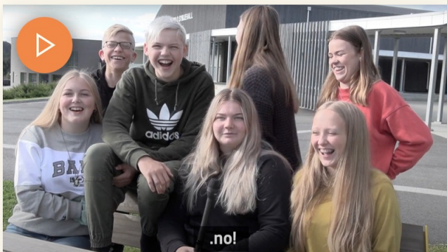
Cookie Policy ation Corona - Bremnes ungdomsskule