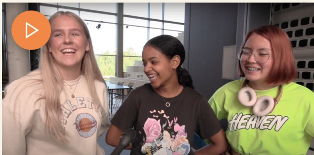
Besøk på Bremnes ungdomsskule