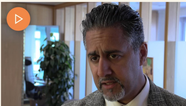
Helsing frå Moster 2024 sine eigarar