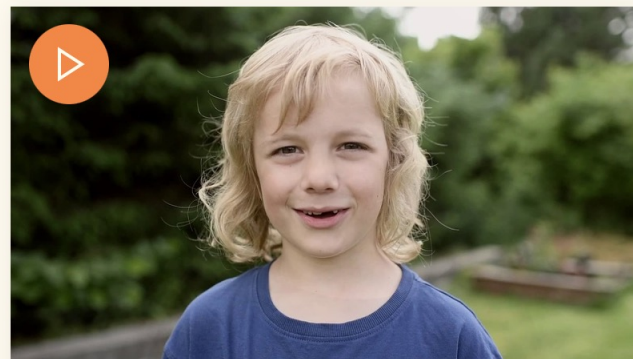
Mitt og ditt jubileum