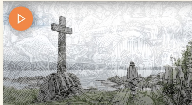
Om Olav den heilage