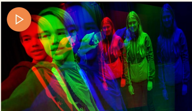
Filmverkstad Generation Corona