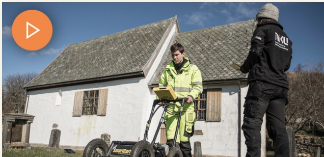
Moster gamle kyrkje - prosjektfase 1 - 2021