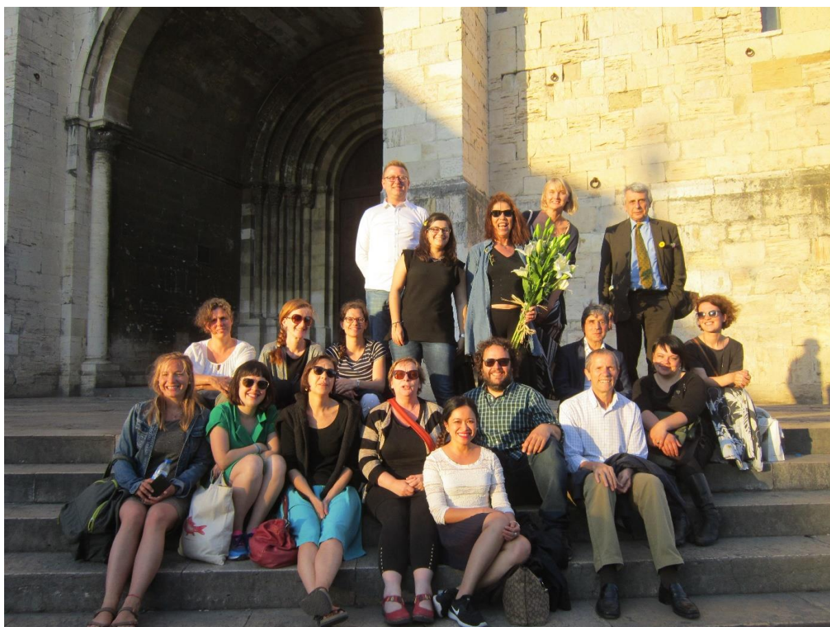
Gjengen klar for Fado, siste kveld av partnersamling i Lisboa.

Til sist kan man sukke høyllytt over EUs byråkrati som gjør at vi må bruke mye på å finne ut hvordan vi skal fylle ut diverse skjema. Det hjalp ikke å ta fram pekefingeren – EU vant denne runden også.