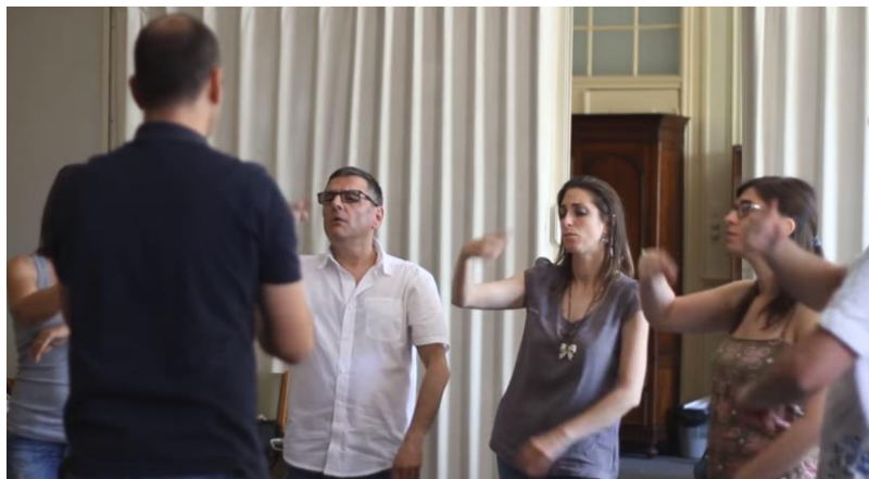
Partis: Et kor med døve deltakere som opptre sammen med et profesjonelt orkester

Gulbenkian Foundation (Stiftelsen som eier alle Gulbenkians etterlatenskaper, forskningsinstitusjoner, industrier, fond og museer) finansierer gjennom et stipend et 3årig prosjekt kalt Partis: Artistic Practices for Social Inclusion, https://gulbenkian.pt/en/news-en/this-is-partis/