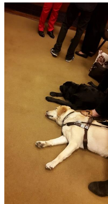
Ikke alle deltakerne var like oppmerksomme hele tiden