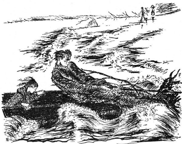
Fløtar-Lars tegnet for leseboka av Henrik Sørensen til utgivelsen 1928.

Sitatet er hentet fra Nordahl Rolfsens søknad til kirkedepartementet fra 1891.