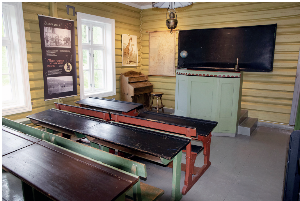
Fra skolestua på Rendalstunet.