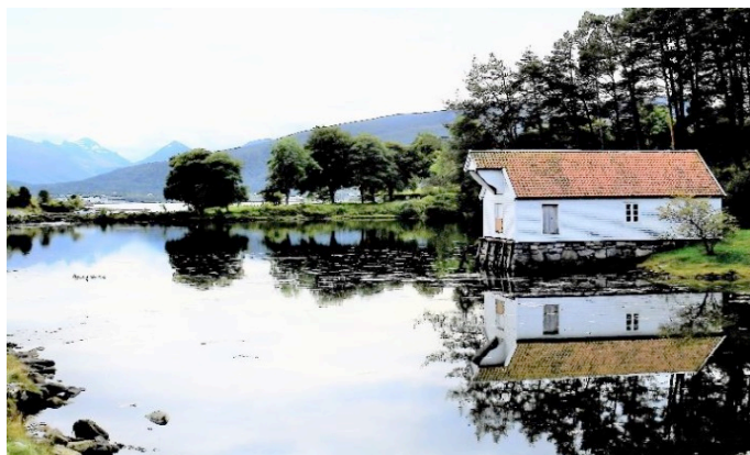
Sunnmøre Museum i naturskjønne omgivelser i Borgundgavlen i Ålesund. Museet har en stor samling av hus og båter.

Årets årsmøte/fagdag vil bli arrangert ved Sunnmøre Museum i Ålesund 6.-8. september. Sunnmøre Museums Venner vil være vertskap for årsmøtet. Sett av datoene allerede nå.