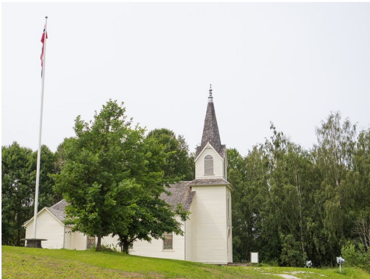
Kirka er nymalt i sommer

Anno museum fikk endelig tilskudd til nytt fellesmagasin. Dette skal bygges ved Glomdalsmuseet i Elverum og betjene alle museene i Anno. Alle museene er representert i en arbeidsgruppe, og det utarbeides felles