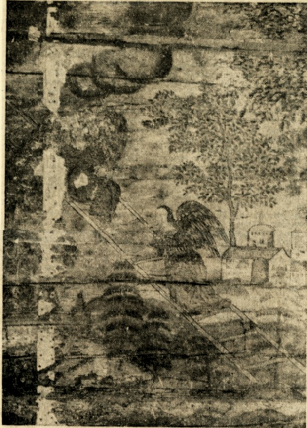
Ett av de målade väggfälten vid Tunnbindaregatan 23 med "Jakobs dröm".