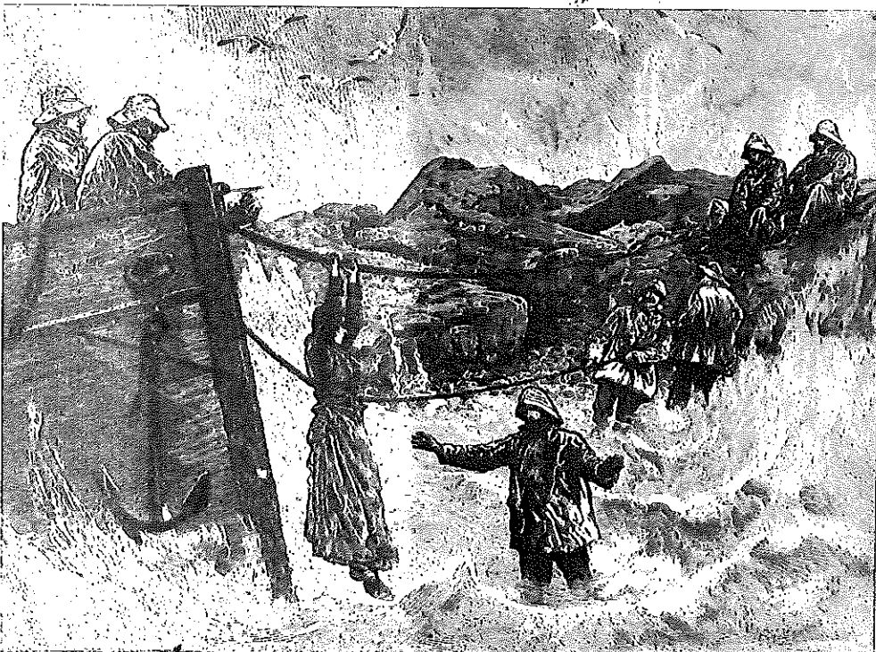
Foreligger forskjellige versjoner av hvordan Betty ble reddet i land på Lepsøy. Slik tegner tenkt seg dramset, etter at han var på stedet kort tid senere.

I fem dager hadde uværet rast over øyene med regn, sludd og iskald vind. Den var flere ganger oppe i orkans styrke, hadde pisket opp sjøen, revet taket av husene på land og blåst overende trær og skigarder. Nå hadde vinden snudd til sør-sørøst, rett på landsvind, og Columbine hadde knapt kommet utenfor den beskyttende havnen i Grutness, før hun kjørte baugen inn i kjempemessige dønninger. Vinden hylte i den knakende riggen da skuta la seg over og sto nordover langs kysten.