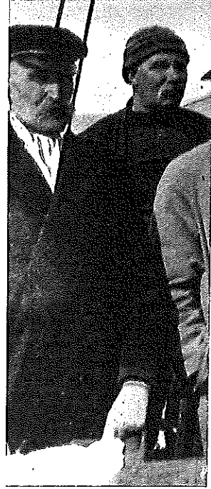
igsnes, en av Bettys red- en lystyacht i Lerwick i

ter styringen. er sto inne på land og så til sjøs, blant dem var ettys halvbror. Etter 30 ig hvordan båten begynte ig. Baugen snudde gang vinden, for så å falle av m og tilbake som om den n, noe var tydeligvis galt