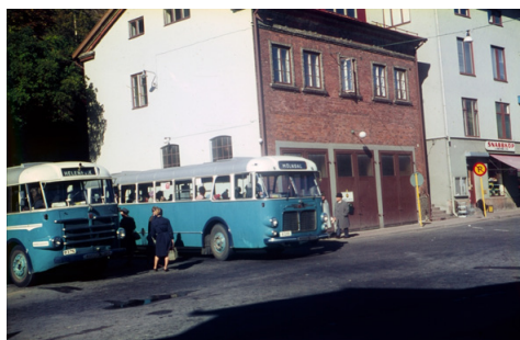
Två blå bussar står på en busshållplats vid Gamla Torget i Mölnadal, 1950–60-tal.