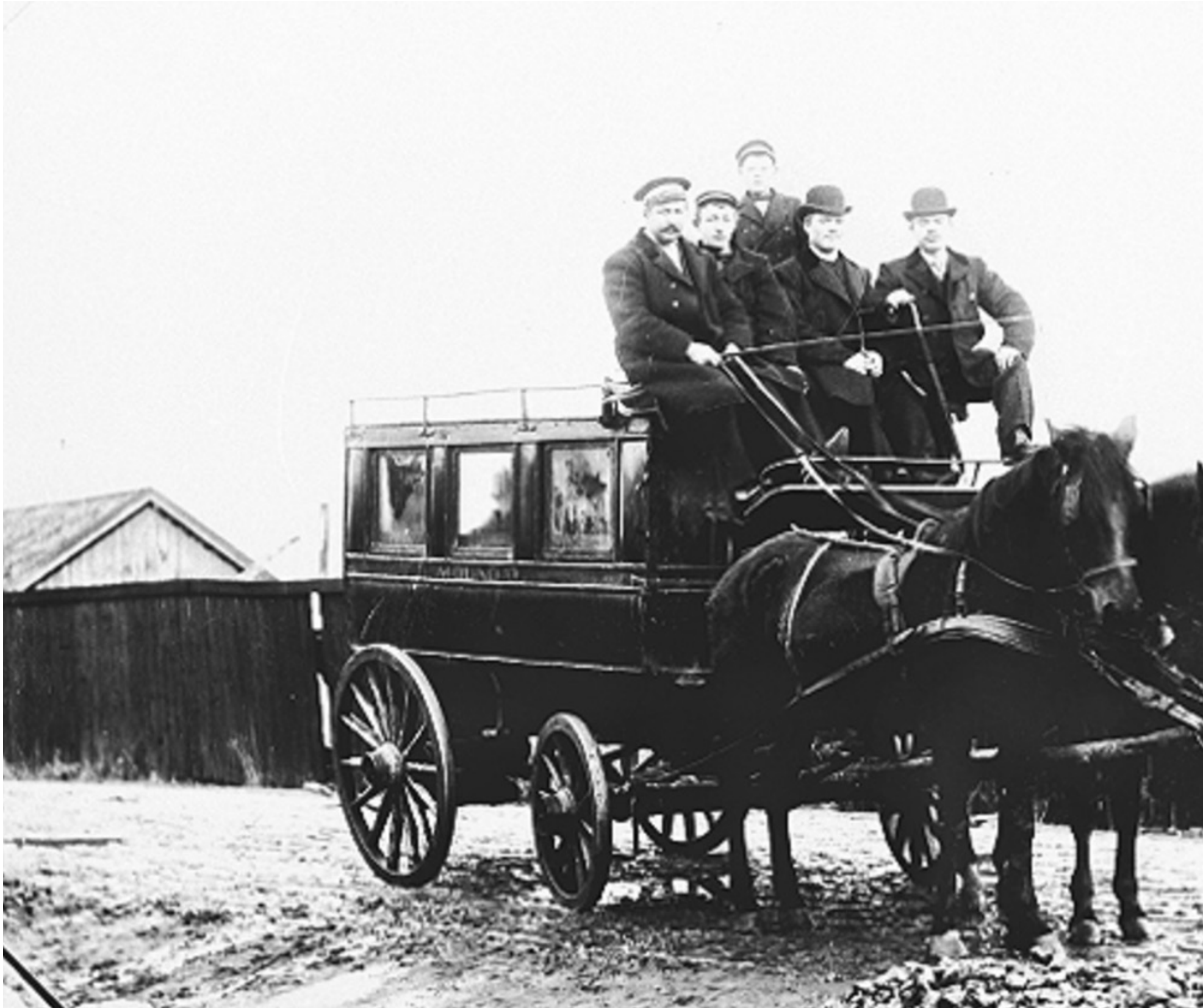
En så kallad hästomnibus i Mölndal 1907.