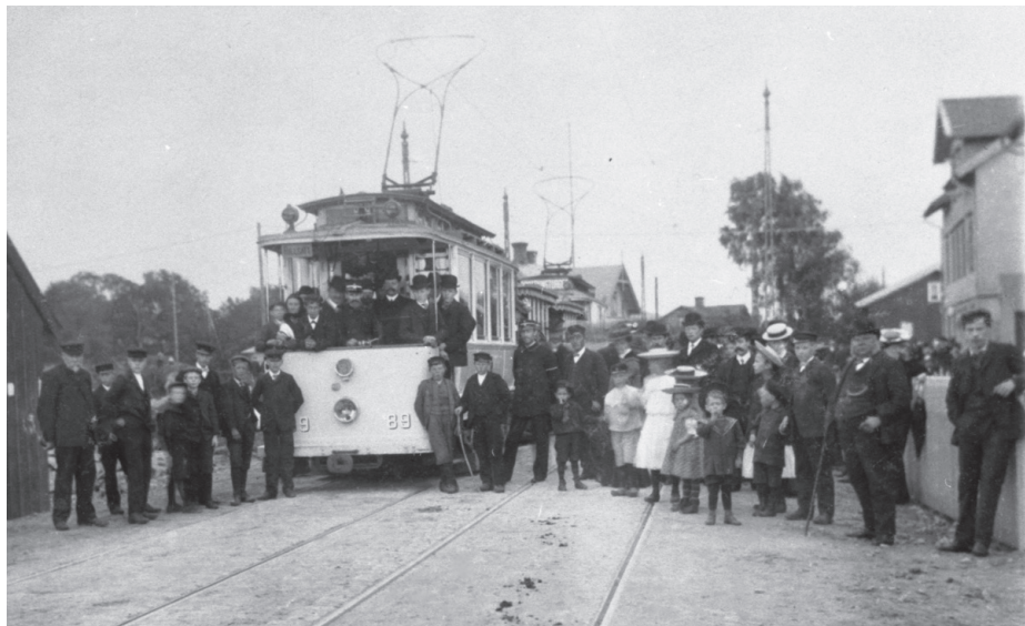
Det var en stor dag den 14 augusti 1907, då den elektriska spårvägslinjen Göteborg–Mölnadal togs i bruk. BILD: MÖLNDALS STADSMUSEUM