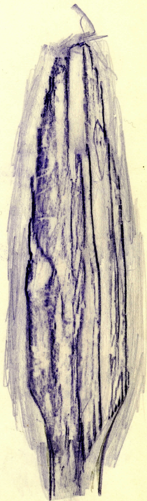
spets i nat. storlek