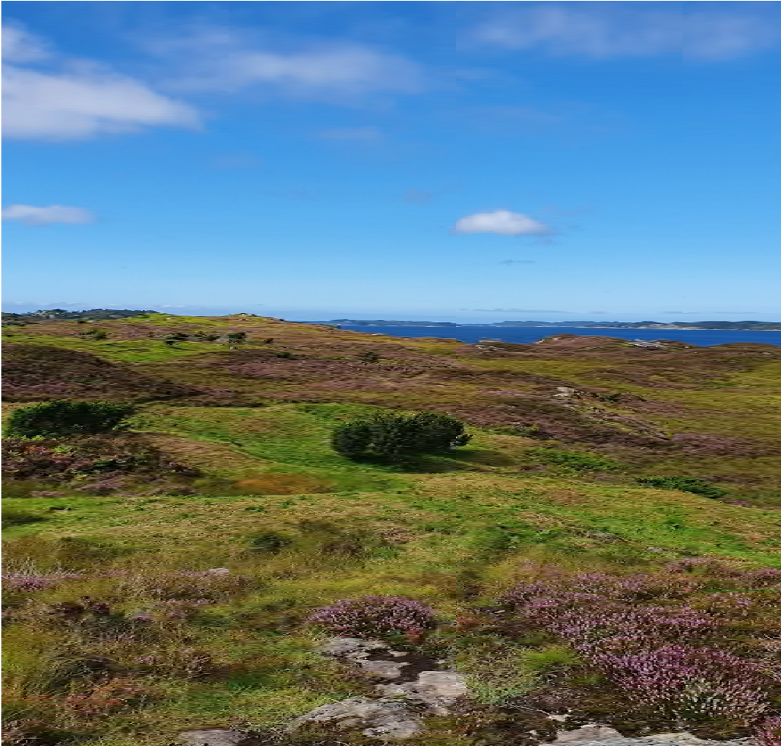
Lyngbløming på Tangane, Ytre Lygra