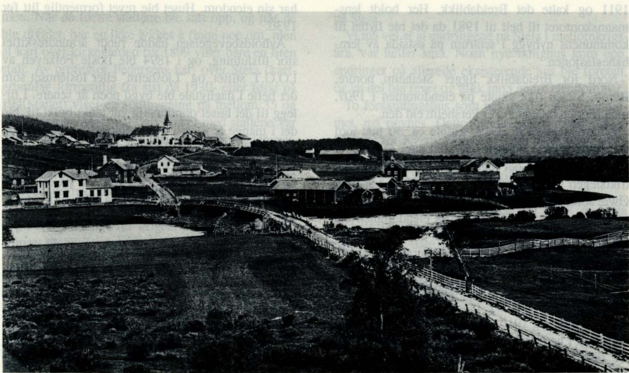
Steien sentrum med kirka, Steien Hotell og kommunelokalet Elvarhaug, nede ved Steibrua skolen.