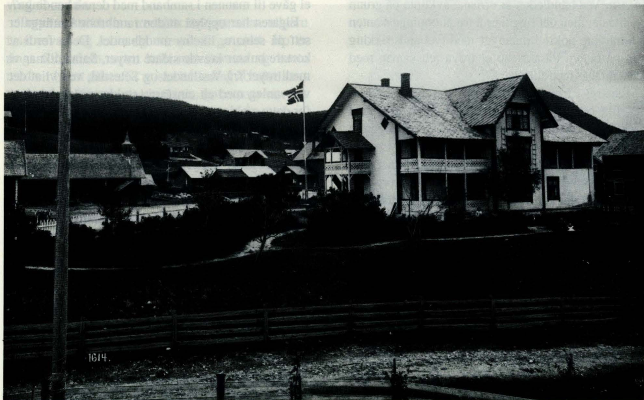
Steien Hotell omkring århundreskiftet.

Når en skal prøve å få til en liten oversikt over utviklingen på Steia, synes det naturlig at meieriet og ungdomsskolen/samfunnshuset blir avgrensingen mot syd. Glåma får være vestgrensen, mens gårdene Stortorhaugen synes naturlig å ta med mot nord, og all bebyggelse mot øst må tas med.