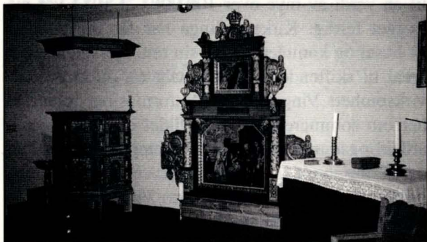
Prekestol, altertavle og alter fra den gamle kirken. Nå plassert i det nye museumsbygget.