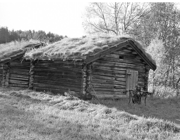
Smea på Dalstrøen

likeeins klangen. Det som kjenneteiknar Dalstrøbjøllan er bellhempa og hanken til å feste klaven/reima i. Festet har ei spesiell utsmiing, forma som eit rundt hjerte. Bjøllan i Dalstrøtradisjon har ei overflate der ein tydeleg kan sjå at "kåppårbrassen" ligg som eit raudbrunt skjær.