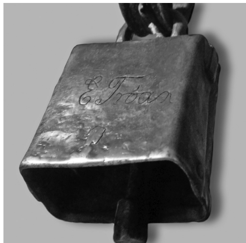
Bjølle etter Ellev Trøen