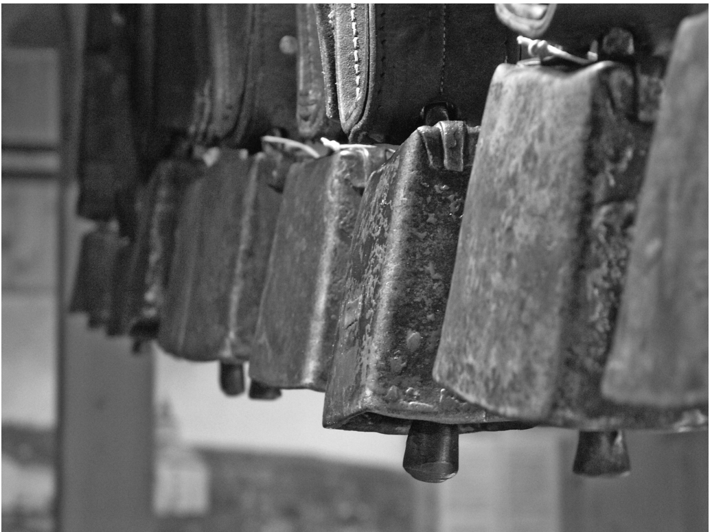
Ei samling kubjøller, alle smidd på Dalstrøen, Fåset

Arbeidet med utstillinga "Kubjøller" ga oss innblikk i ein handverkstradisjon som ein neppe tenker over, og som no har gått i gløymeboka. Dette emnet hadde meir innhald enn me først trudde, og me fann informanter som hadde høyrd, visste og kunne fortelje. Utstillinga vart presentert ved Museumssentret Ramsmoen sommaren 2005. Utgangspunktet var ei lita samling bjøller som var laga på Dalstrøen på Fåset. På denne garden har det vore bjøllsmeder i to generasjoner, i eit periode på bortimot 100 år. Herifrå er det spreidd bjøller til mange av bygdene i Østerdalen.