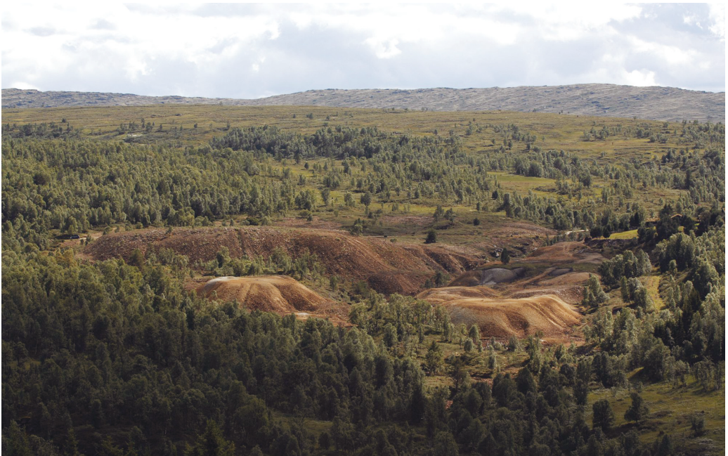
Gruveområdet ved Kvikne kobberverk i dag.

Kvikneverket var eldre enn Rørsverket, og var også det største i noen år. Men på slutten av 1600-tallet gikk det nedover med drifta. Det var sågar helt stillstands noen år omkring århundreskiftet. Men fra 1708 vart det ny drift att, dog aldri i samme omfang som i de første tiåra. Under Storofsen i 1789 rant hovedgruva full av vatn, og sia var det bare ei svært redusert drift på noen mindre forekomster fram til omkring 1812.