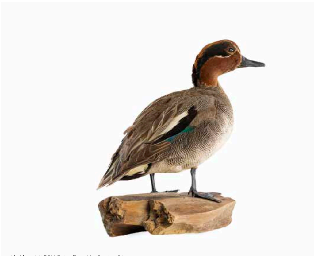
Utstoppet krickand, NØBV.