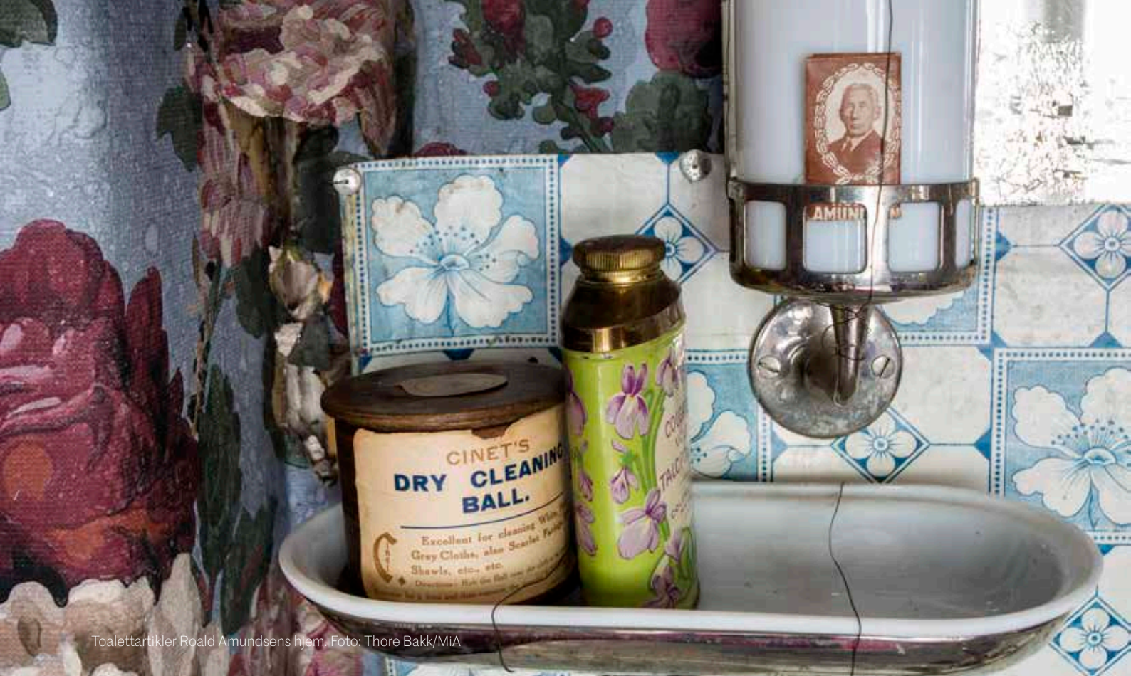
Toalettartikler Roald Amundsens hjem.