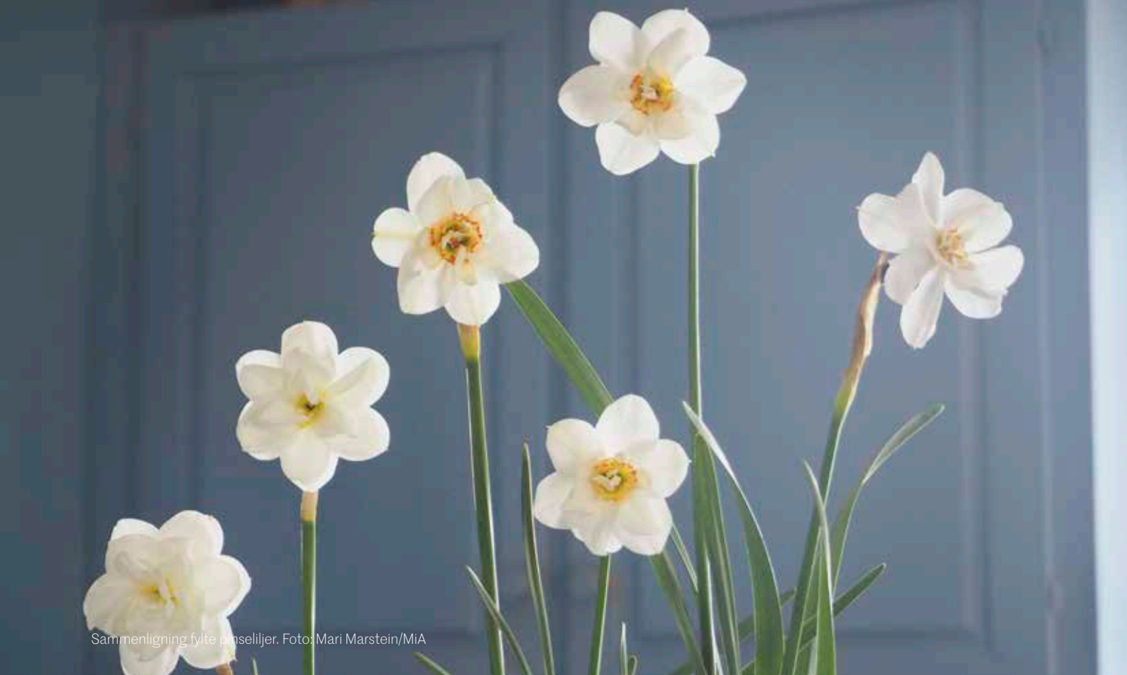
Sammenligning fylte pmseliljer.