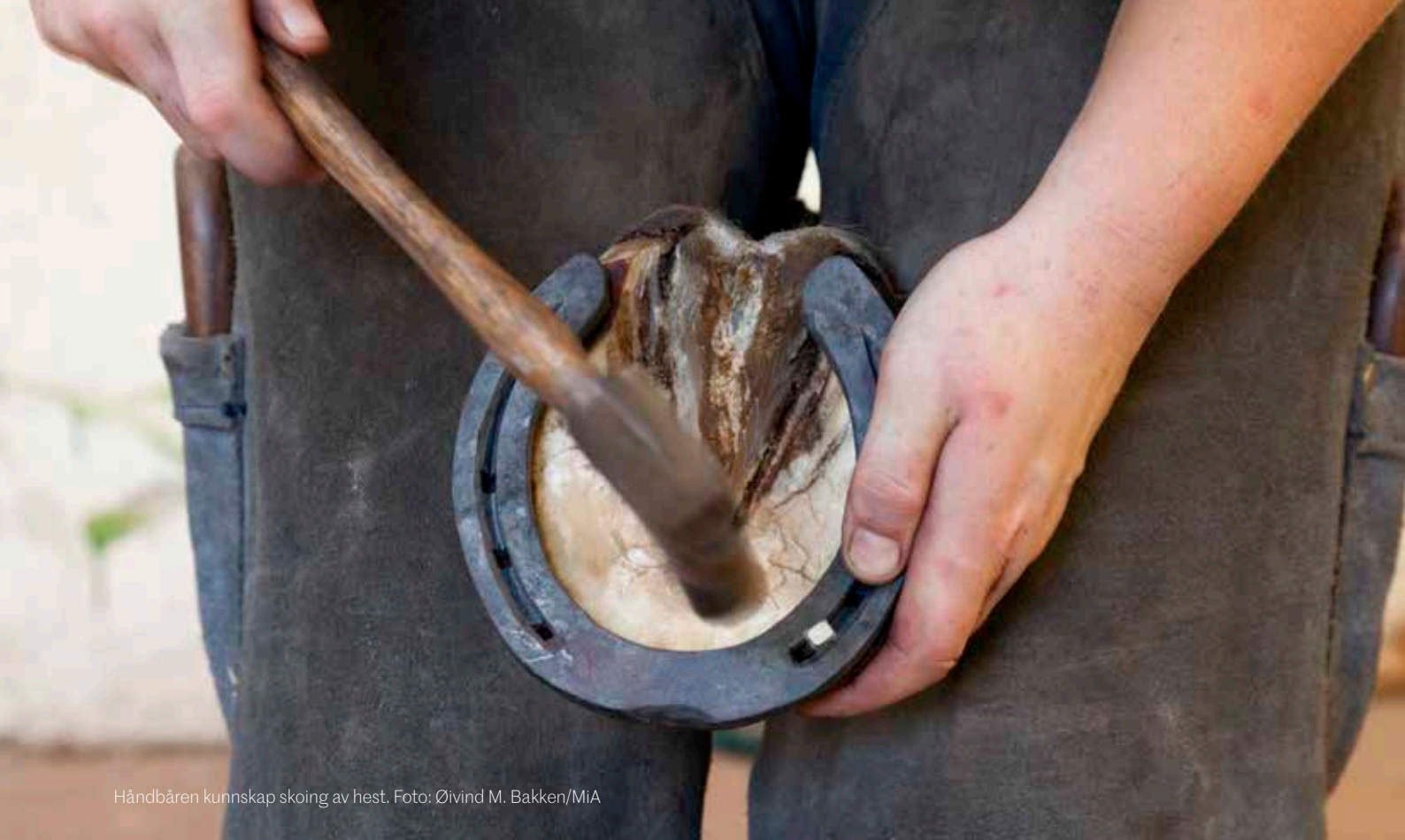
Håndbåren kunnskap skoing av hest.