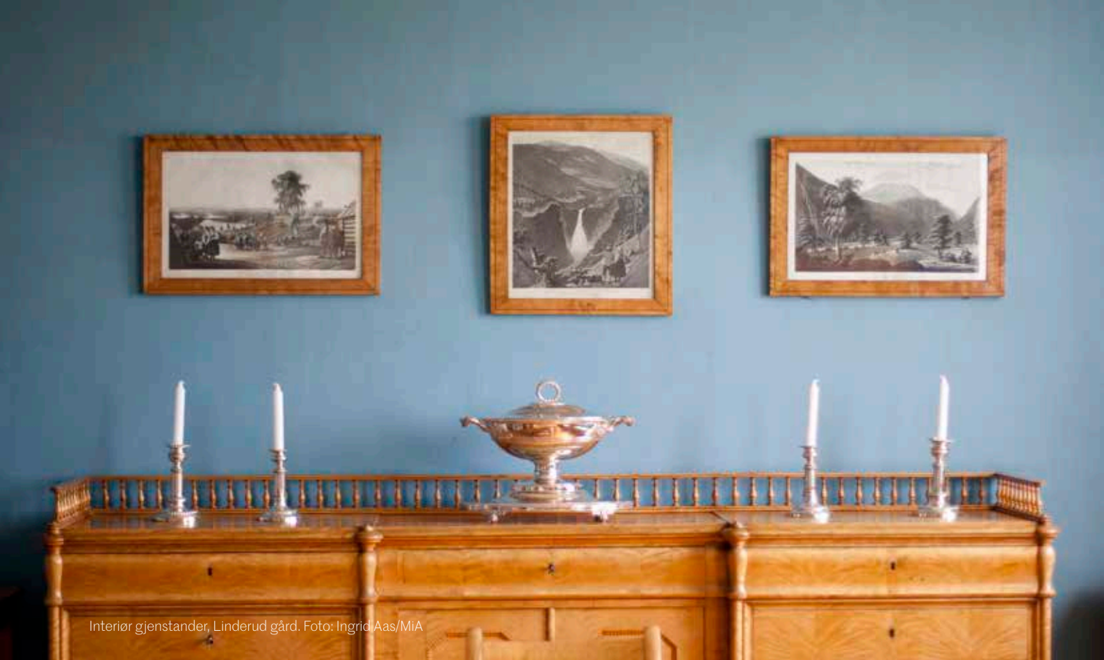
Interiør gjenstander, Linderud gård.