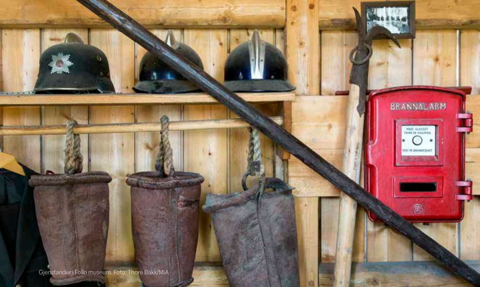
Gjenstander i Follo museum.