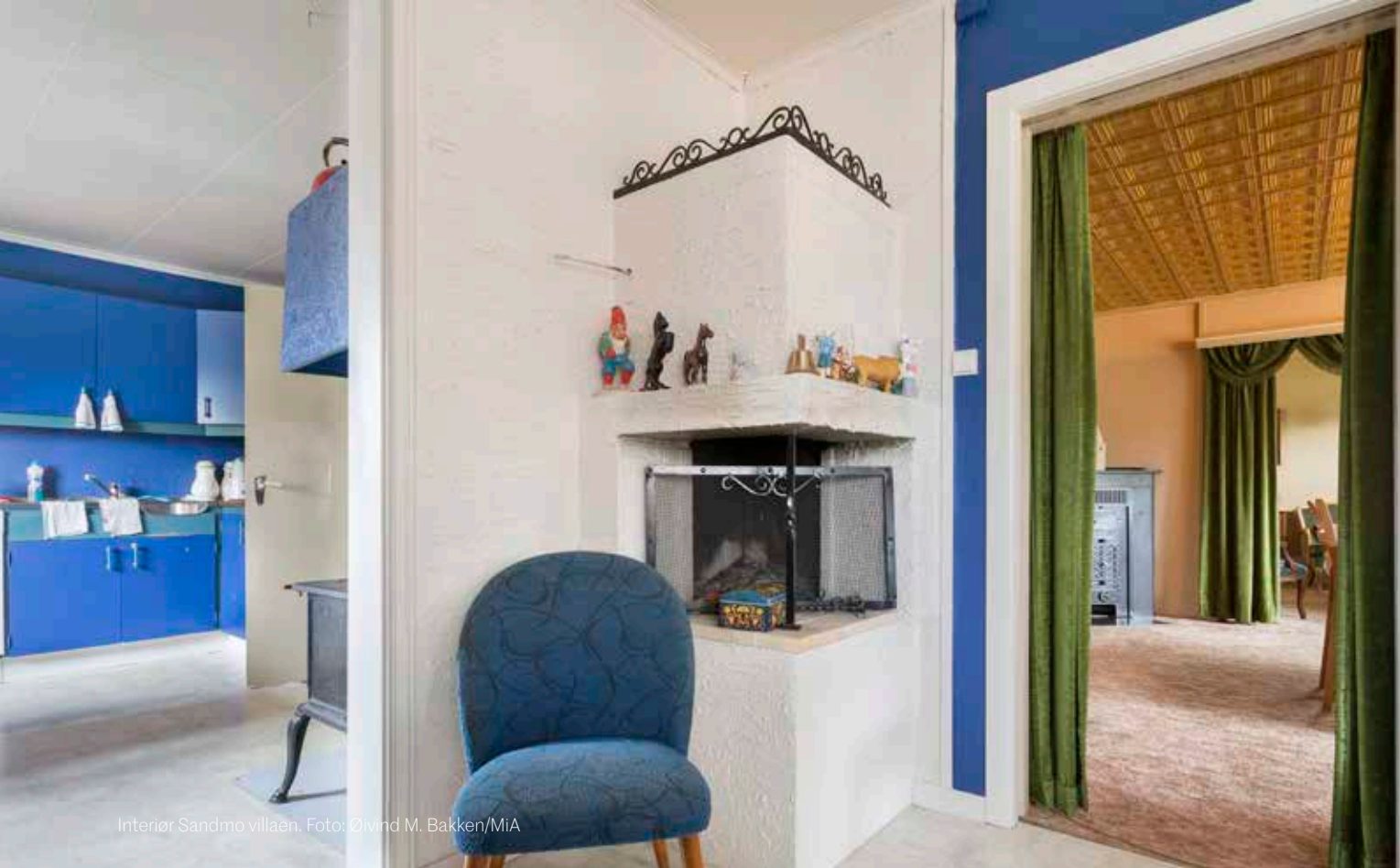
Interiør Sandmo villaen.