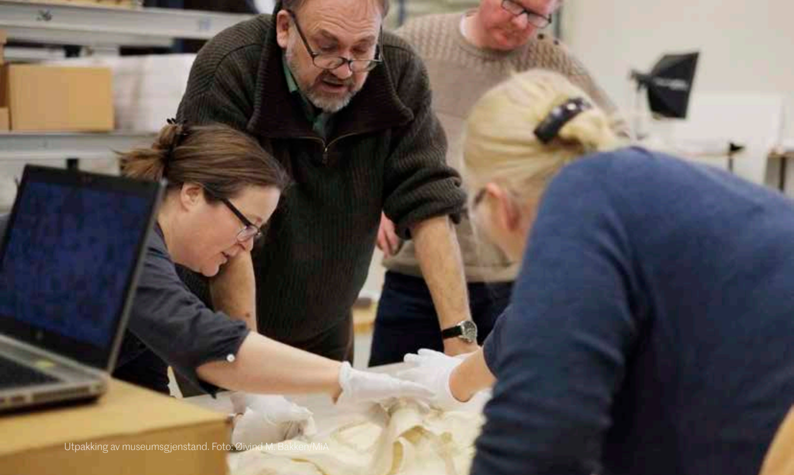
Utpakking av museumsgjenstand.