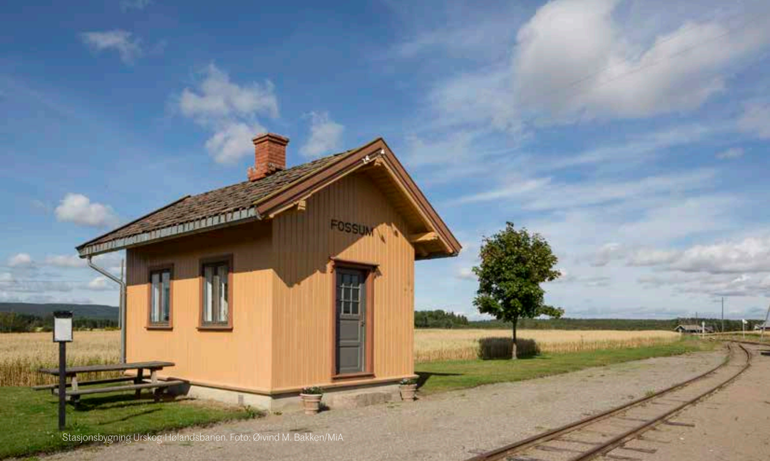
Stasjonsbygning Urskog-Hølandsbanen.