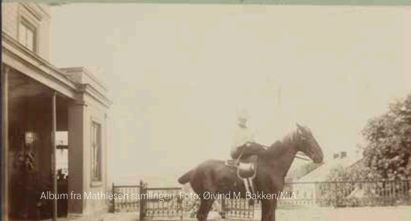
Album fra Mathiesen samlingen.