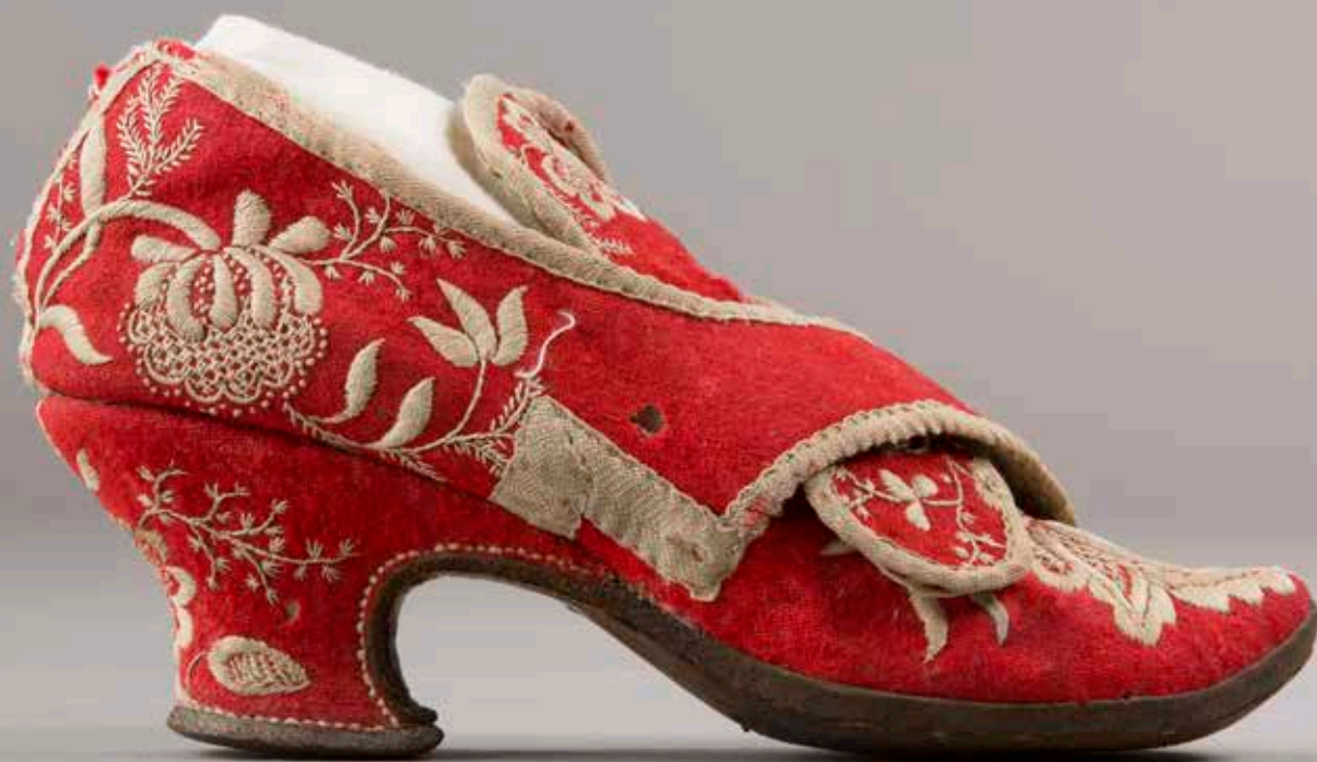
Brudesko 1700-tallet Gamle Hvam museum.