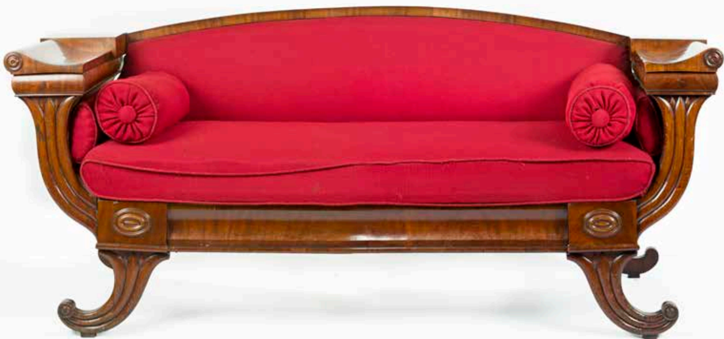
Biedermeier sofa 1800-tallet Asker Museum.