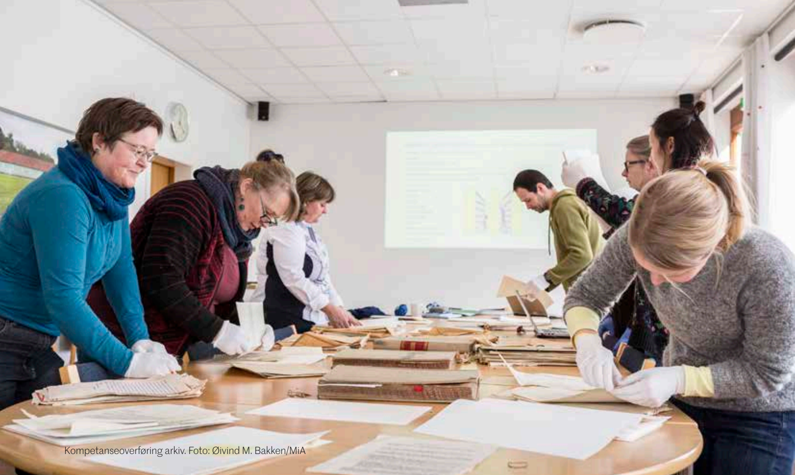
Kompetanseoverføring arkiv.