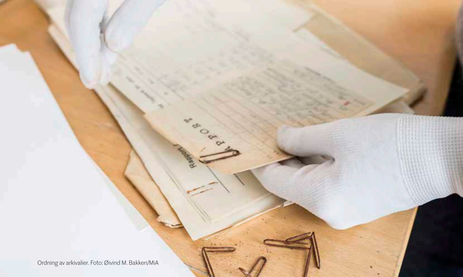
Ordning av arkivalier.