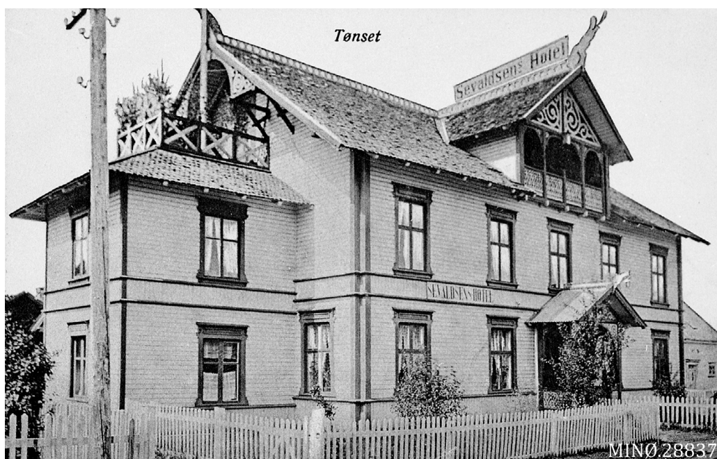
Prospektkort: «Tønset». Foto Normann, ukjent årstall. «Sevaldsens Hotel», det som nå er Tynset Hotell. Musea i Nord-Østerdalen, nr. 28837.