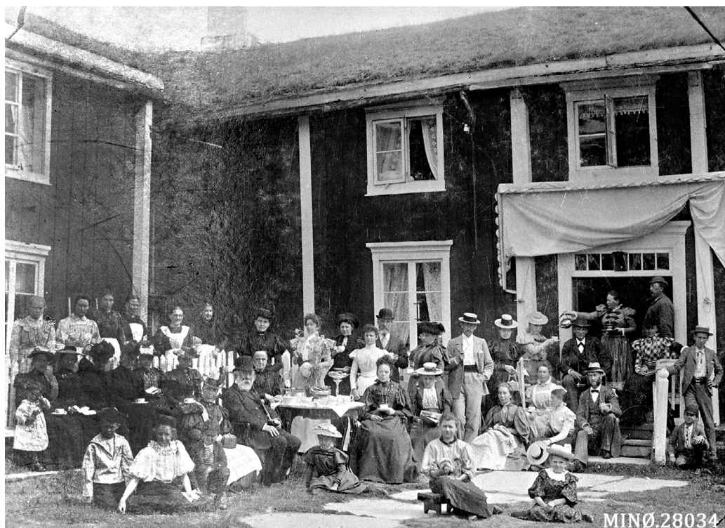
Fra tunet hos Tangen på Neby, Tynset, med mye folk samla ute. Ukjent årstall. Musea i Nord-Østerdalen, nr. 28034.

ten, for den som ikke var frampå, måtte bare nyte duften av varm, nytrukket kaffe og synet av de siste smørbrødene. Om en da ikke har andre intensjoner og vandret rundt i den idylliske stasjonsparken med sin kjære venninne og nesten kom for seint til toget, når det endelig blåses til ny avgang videre sørover. På Elverum pakkes toget til den siste plass og det kjennes godt endelig å kunne komme ut på Hamar stasjon, der en ny kamp må kjempes for å få plass på Kristianiatoget. Østerdølen innsender kapitulterer og vil heller tilbringe resten av dagen og natta på et av Hamars mange innbydende hoteller.