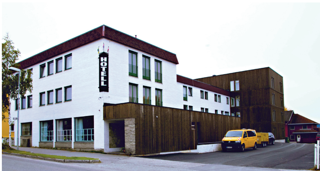
Nåværende Tynset Hotell.

Brugt. 6A. Sevaldsens hotell ble startet i 1897 av Olaus Sevaldsen og kan altså se tilbake på drift i over 120 år. Nytt bygg ble satt opp i 1962 og navnet ble Tynset Hotell, modernisert og påbygd i 2018 og klar for ny innsats.