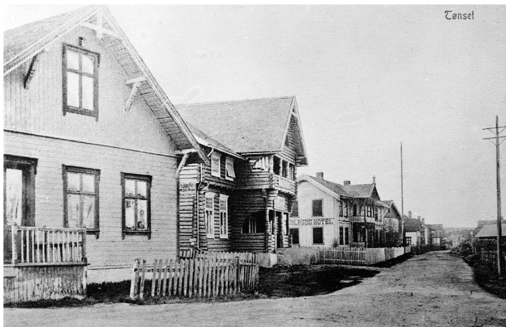
Prospektkort: «Tønset». Fotografert bortover Kongsveien, ukjent årstall. «Schulruds Hotel» på venstre side borti gata. Musea i Nord-Østerdalen , nr. 26557.

Å drifte et skysskifte var en rettighet med betydelige plikter. For det offentlige var det viktig å få løst oppgavene så billig som mulig, så det var konkurranse mellom