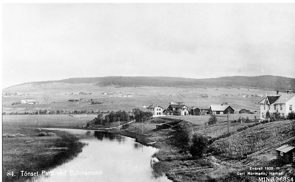
Prospektkort: «Tønset. Parti ved Bjørnsmoen». Foto Normann, 1920. Stasjonstjønna t.v. og i høyre bildekant eiendommen Solbakken, «Aaslands Hotel». Musea i Nord-Østerdalen, nr. 26854.