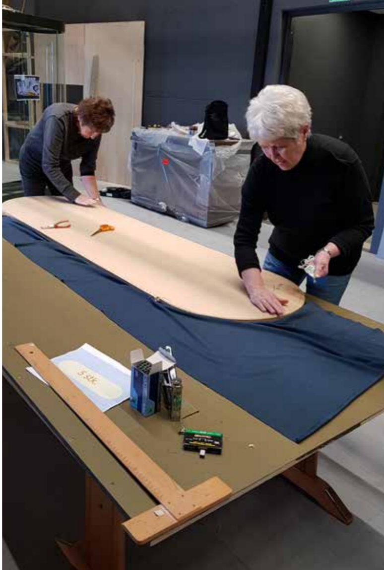
Frivillige i arbeid ved Museet Kystens Arv.

MiSTs nettsider (også avdelingenes) tilfredsstillende minimumskravene for universell utforming jfr DIFIs spesifikasjoner. I tillegg har det blitt gjort endringer som gjør nettsidene enda