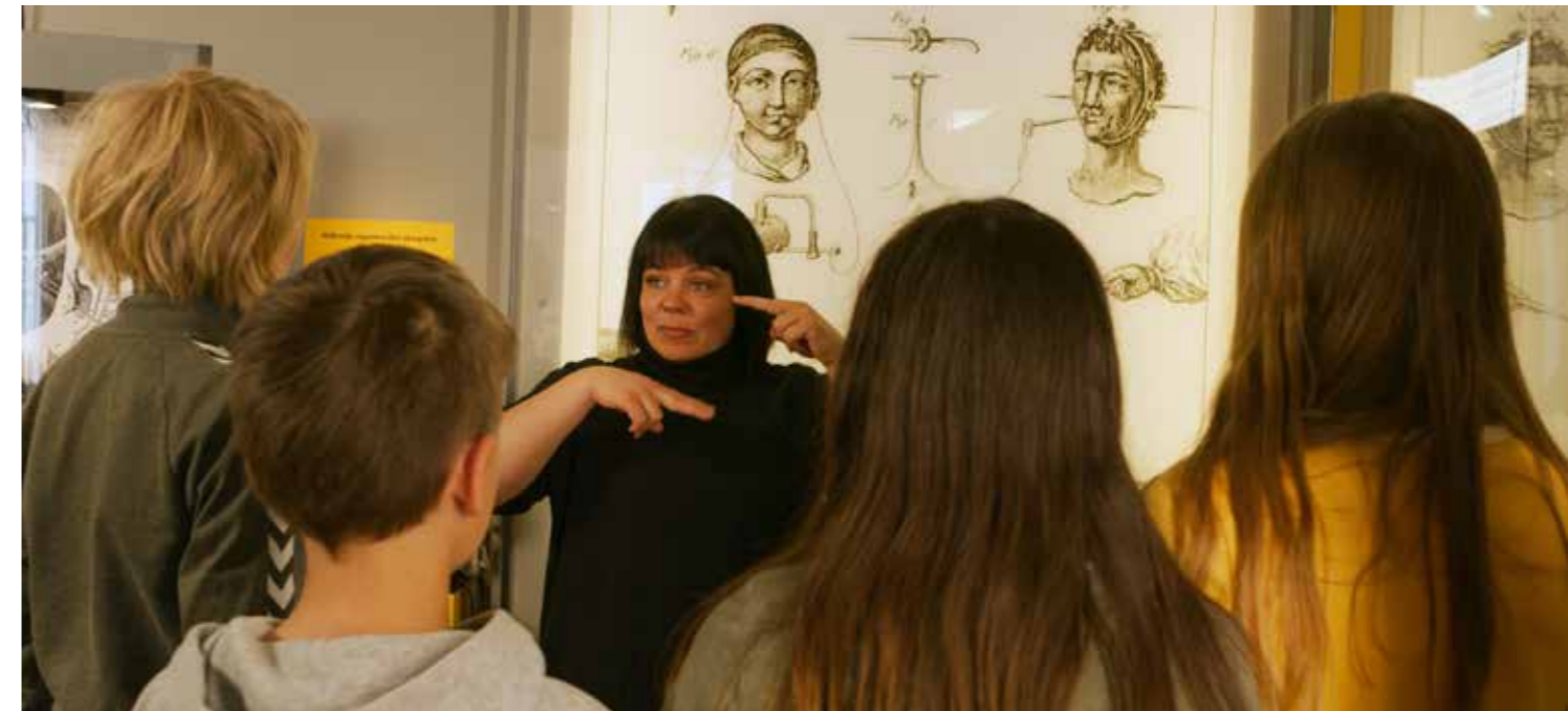
Museene legger til rette for kunnskap, dannelse og opplevelser, her ved Norsk Døvemuseum.

kommer hele organisasjonen til gode, det være seg prosjekter finansiert av Kulturrådet, EU, EØS eller Nordplus. MiST UE administrerer og deltar også i utvikling av store forsknings-søknader sammen med ulike miljø ved NTNU (Horizon 2020). Internasjonale og nasjonale verv, som i ICOMs organer, European Museum Academy, NCK og Norges Museumsforbund, er også med på å synliggjøre vår organisasjon nasjonalt og internasjonalt, og tilfører organisasjonen kompetanse. Mange utviklingsprosjekter i MiST er prosjekter som har som mål å finne gode løsninger for museene nasjonalt. I mange av disse prosjektene deltar flere av museene i MiST, selv om de i statistikken er plassert i UE som har prosjektledelse. MiST har i 2019 deltatt på flere arrangement i EØS/EU-sammenheng, der målet er å dele erfaringer og få flere museer til å søke disse midlene.