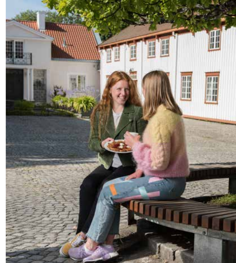
Museet som møteplass, Ringve Musikkmuseum.

Høsten 2019 kjøpte vi inn det samme verktøyet som er benyttet i den nasjonale undersøkelsen, og har startet opplæring i bruk av spørreundersøkelser. MiST har som målsetting at flest