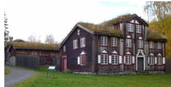
De de antikvariske bygningene utsettes for større påkjenninger som følge av fuktigere vær.

Museenes formidling med fokus på klima og miljø er i hovedsak knyttet til kystkulturen. MKA har i 2019 hatt utstillinger med tema havet og forurensing.