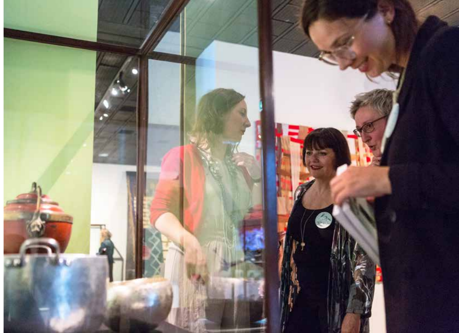
Fra åpning av utstillinga "125" på Nordenfjeldske Kunsthistoriskmuseum.

De aller fleste museene har hatt samarbeid med kommuner, skoler, NAV, Røde Kors og andre som arbeider med flyktninger/innvandrere. Det kan være språkopplæring, arbeidstrening eller annet alt etter behov. Ikke alle kommuner har bosetting av flykninger, så tilbudet er ikke like relevant for alle avdelingene.