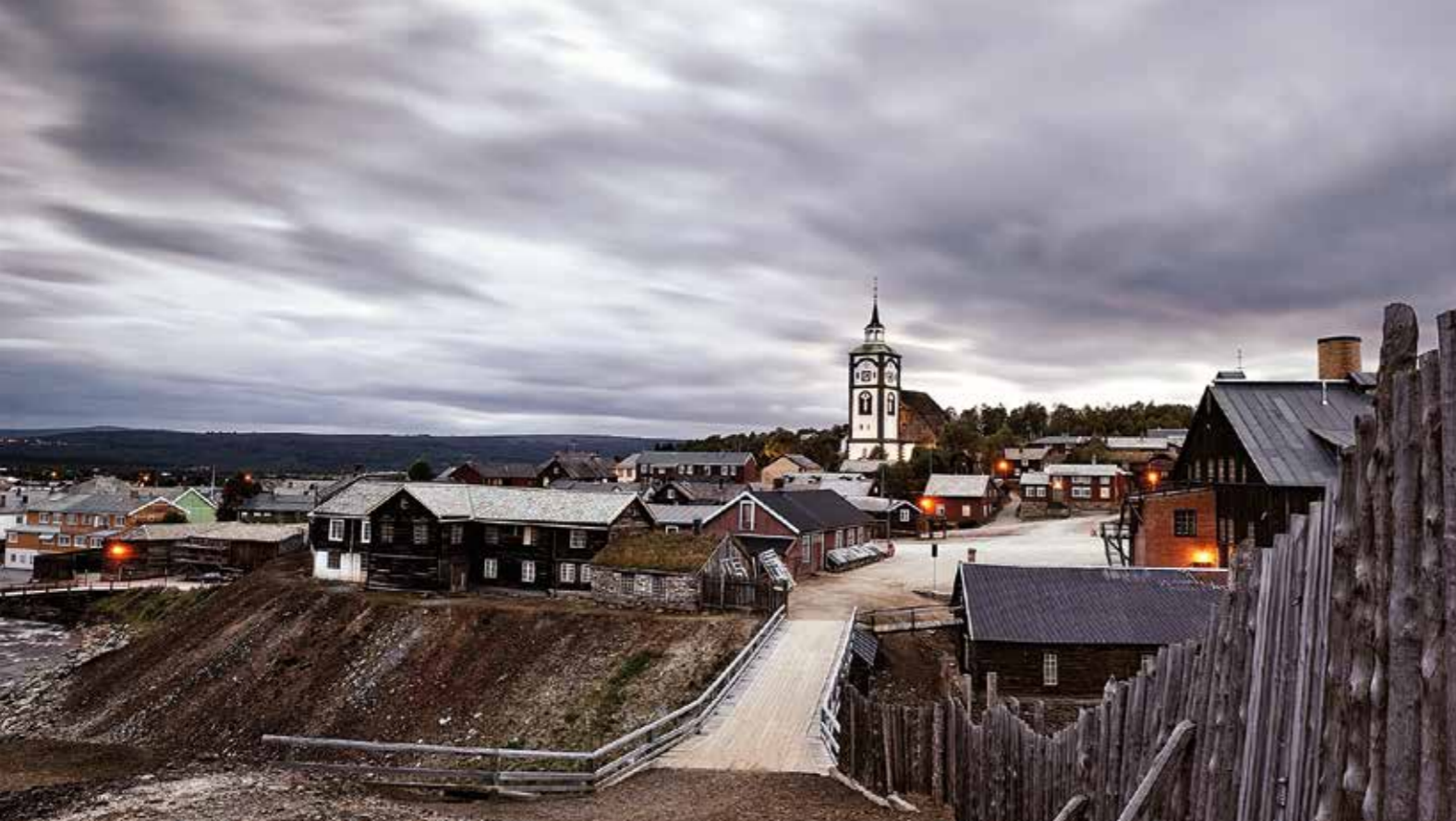
Verdensarvsenteret på Røros ble formelt åpnet i 27. september