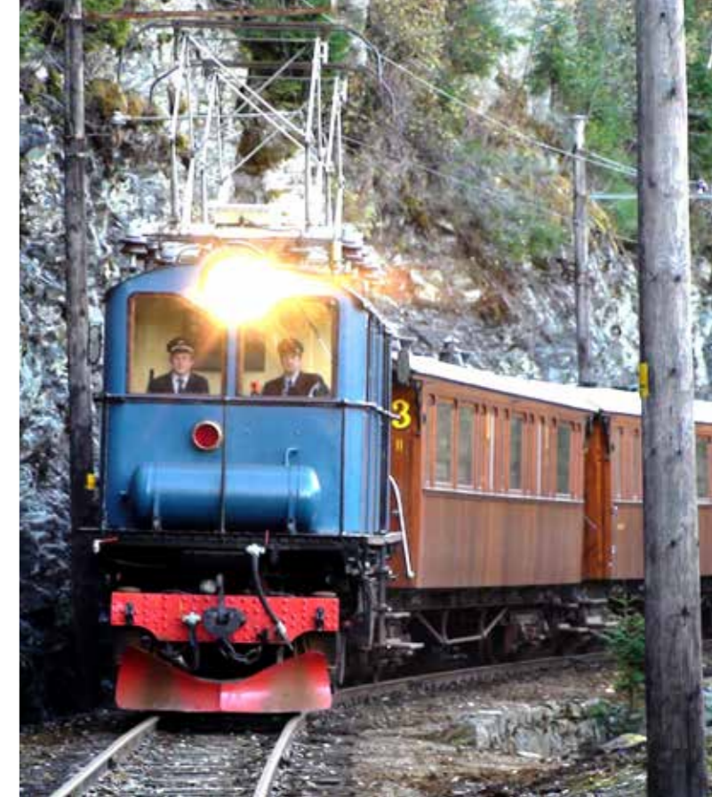
Thamshavnbanen er Norges eldste elektriske jernbane, og blir drevet og forvaltet av Orkla Industrimuseum.

I tillegg til Rørosmuseets arbeid med industrielle kulturminner forvalter Orkla Industrimuseum Norges eldste elektriske jernbane, Thamshavnbanen. Både infrastruktur og tilstrekkelig