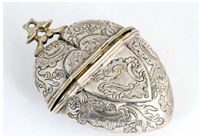
Et «hjerne»-formet luktevannshus, rikt dekorert, med forgylte turtelduer som pryde på lokket.