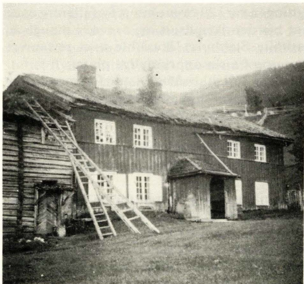
Hovedbygningen i gamle Prestgarden i 1920.

En skal huske på at i hele prestegarden var alle rom tømt for inventar, ikke så mye som ei fyrstikk var igjen, men red-