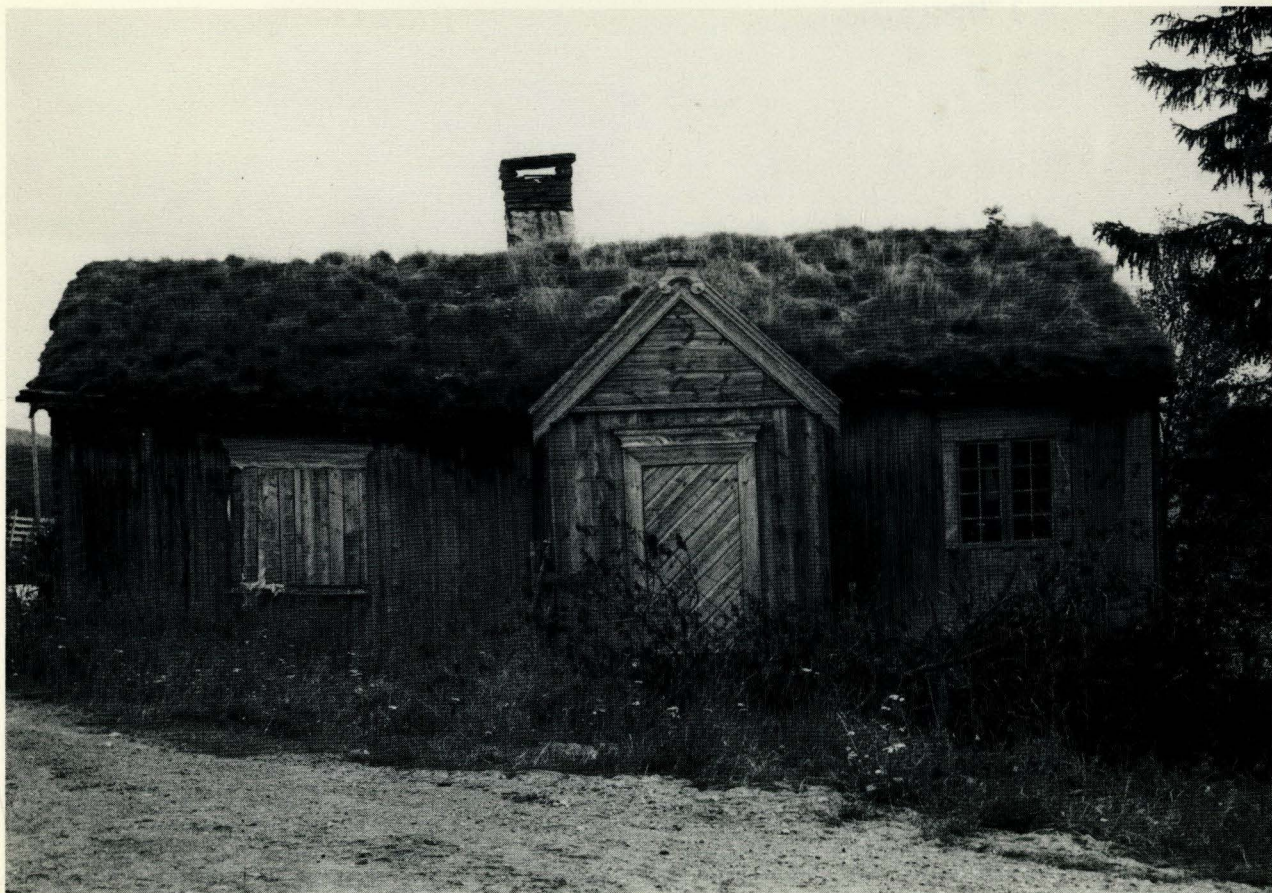
1600-talls østerdalsstue på Sumundsjordet i Vingelen, Tolga. Gammel, men ikke mett av dage. (62561)

elen, men etter hvert var det mulig å skaffe fra andre bygder. Så nå er det 7 handverkere og 2 arbeidsledere i sving, og et omfattende arbeid er gjort. I samarbeid med Arbeidskontoret er det også satt igang et AMO-kurs, Arbeidsmarkedsopplæring- i restaurering, slik at kunnskapene og ferdighetene kan styrkes. På denne måten legges det