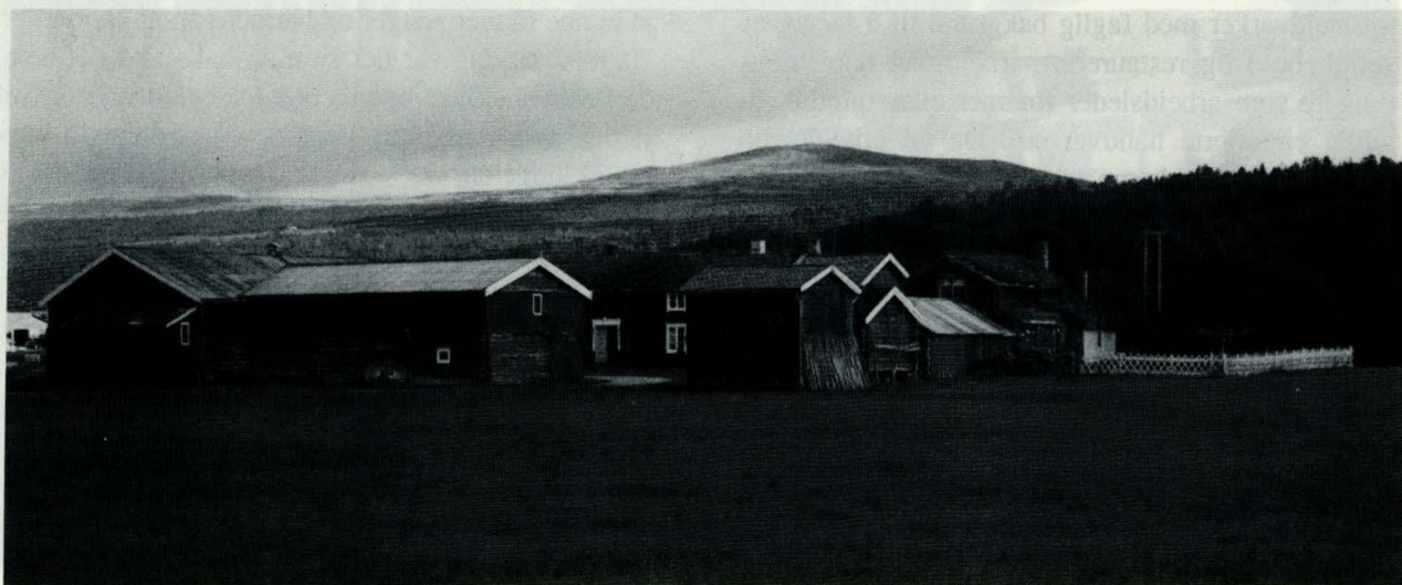
Ryen vestre, Narjordet, Os. Et sjeldent fint, intakt 1800-talls gardsanlegg. Det eldste huset er sommarstua helt til høgge. Den ble bygd i 1802. (65096)

I Os kommune, eller i hele regionen for den del, er det ikke mange intakte 1800-talls gardstun igjen. Ett av dem er Ryen vestre i Narjordet, et velholdt, ryddig, vakkert gardsanlegg som er en fryd for øyet, - og ikke minst av uvurderlig miljømessig ver-