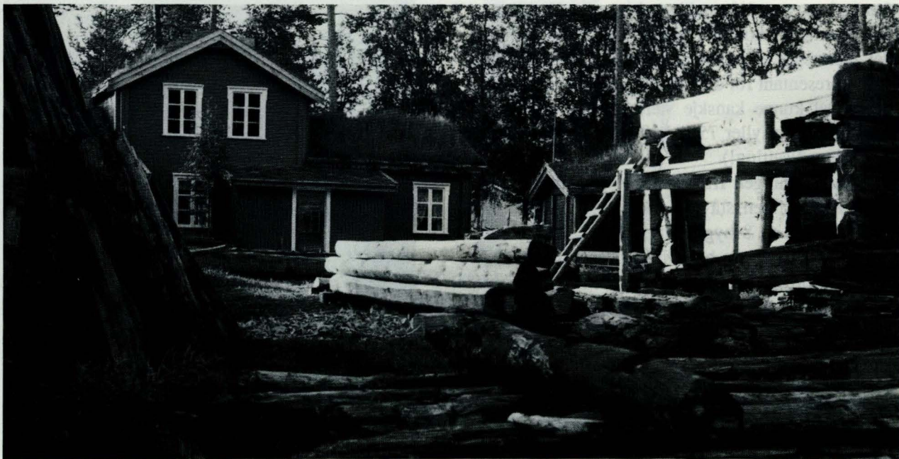
Tynsettunet på Tynset Bygdemuseum. I bakgrunnen Motrøbygningen, Lonåsstua, foran: Stallen fra Løkken, Kviknesko- gen, under oppsetting, nå er den nesten ferdig, og blir riktig staselig.

Nord-Østerdalen og ellers er det lagt planer for videre utvikling av samarbeidet - Museumsregionen blant annet med flere fagstillinger. I alle år sia 1977, om att og om att, har Samrådsmøtet og andre ytret ønske om 1 - én - fast stilling til i kultur- arvens tjeneste, en hel handverkerstilling. Musea har sia 1976 hatt én heltids fast ansatt, bestyrer / konservator, som er etnolog av utdanning. Resten av staben består i dag (29. november 1991) av: en halv fotograf (ved museet sida 1987). Resten er personer som er knytt til museet svært løst, nemlig så lenge det er mulig å skaffe penger til lønn og drift. Dette er: 2 museumsarbeidere på spesielle opp-