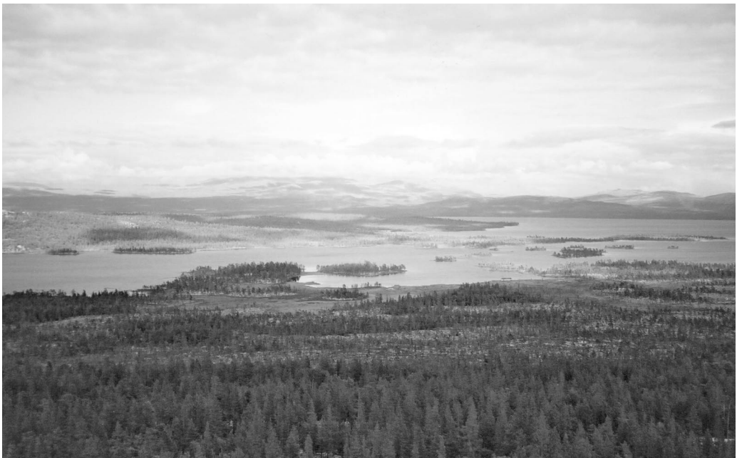
Kvennvika ved Femunden.

Inst i Kvennvika er det det no ti hytter som er bygde på statens grunn i slutten av sekstiåra og utover syttitallet. Lenger ute i vika er det gamle fiskebuer som minner om det gamle næringsfisket. Yst ute er det fleire holmar, med Storholmen i midten, som lagar liksom to innløp i Kvennvika. På sørsida og innafor her er Settingen. Sett-