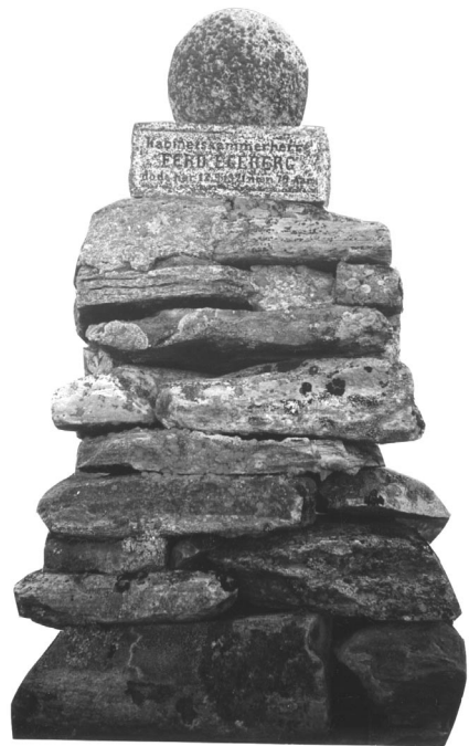
Egebergs minnestøtte på Tolga østfjell.

Kabinettskammerherre Ferd. Egeberg døde her 12.9.1921 nær 79 Aar