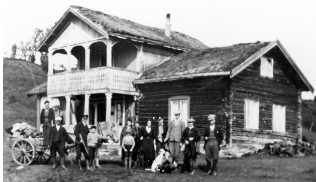
Jegere klar for heimreise sammen med folket på Vestre Orkelbogen. (100437)