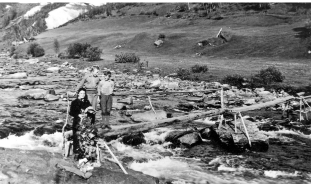
På gangtreet over Orkla. (100440).