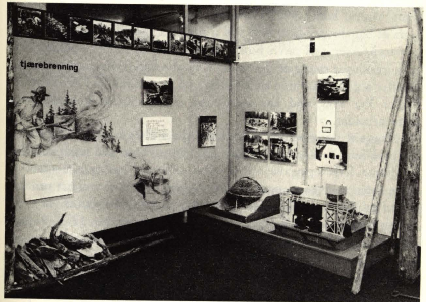
En utstilling om tjærebrenning og en om kolbrenning ble montert ferdig i 1974.

Den nymontering som har skjedd i 1974 er til dels en videre utdyping av detaljer som kartene over fiskeplasser og fiskemetoder i Mjøsa og nedre del av Gudbrandsdalslågen er eksempler på, dels er