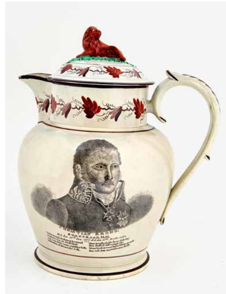
Punsjemugge med påtrykt portrett av statsråd og stortingspresident Christian Krohg på den ene siden og Eidsvollsbygningen på den andre. Som leder av konstitusjonskomiteen fikk Christian Krohg hovedæren da Stortinget 17. mai 1814 avviste en rekke forslag fra Carl Johan om endringer i Grunnloven. Forslagene ville gitt kongen mer makt og ført til en tettere union med Sverige. Da den sterkt selvkritiske Krohg tok sitt eget liv fire år senere, ble han hyllet som en nasjonalhelt i Norge. Det oppsto en hel «minnekultur» rundt hans navn, noe blant annet denne muggen, trolig produsert i England ca. 1830, er et uttrykk for.