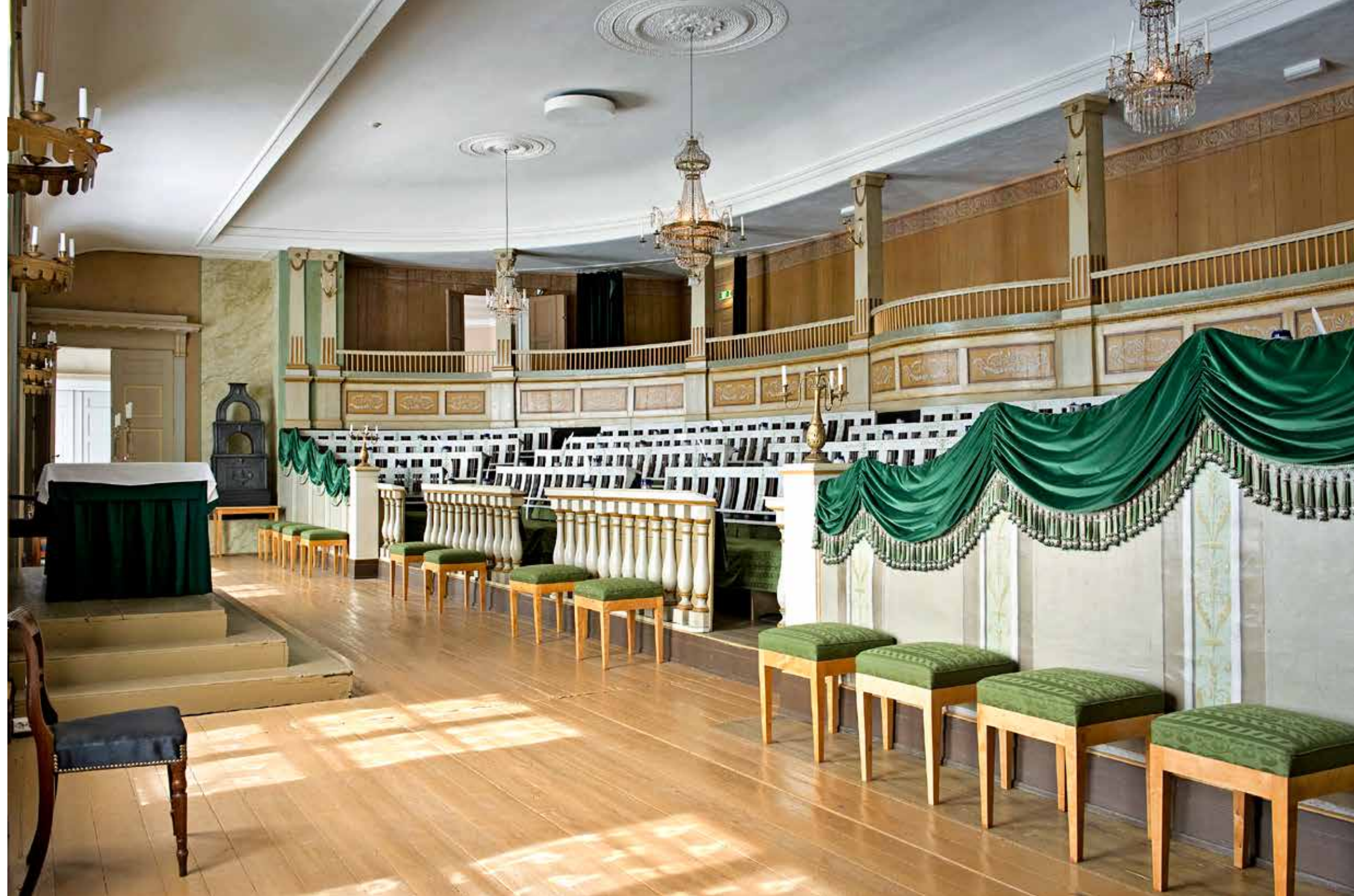
I 1800 tok Katedralskolen i Christiania i bruk et nytt auditorium. Dette var lenge byens største og langt på vei eneste representative forsamlingslokale. Da myndighetene så seg om etter et egnet sted for Stortinget høsten 1814, falt valget derfor på det. I begynnelsen måtte skolen flytte ut hver gang Stortinget var samlet (ordinært hvert tredje år), en tungvint ordning som varte til 1823. Da overtok Stortinget hele gården. Stortinget vokste til slutt ut av Katedralskolens lokaler, og i påvente av at den nåværende stortingsbygningen sto klar i 1866, ble møtene flyttet til Universitetets festsal i 1854. Den gamle stortings salen kan i dag ses på Norsk Folkemuseum.

Hvem var disse embetsmennene, og hvor kom de fra?