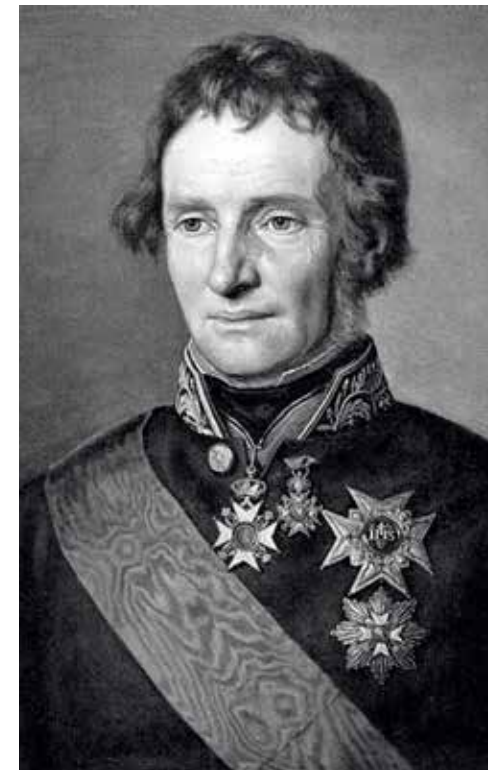
Jørgen Herman Vogt kan karakteriseres som en erketyrisk representant for den norske embetsmannseliten i første halvdel av 1800-tallet. Gjennom sin 57 år lange funksjonstid hadde han nesten alle tenkelige stillinger i regjeringsapparatet, inkludert 13 år som finansminister og to perioder som regjeringsleder (den gangen kalt førsteminister) i 1850-årene. I likhet med de fleste av sine samtidige kolleger var Vogt hardtarbeidende, nøysom og høyt kompetent, men også elitistisk, teknokratisk og en smule anonym. Portrett av Aasta Hansteen fra 1853.

Embetsmennene dominerte lenge ikke bare på Stortinget. Fremfor alt behersket de regje-