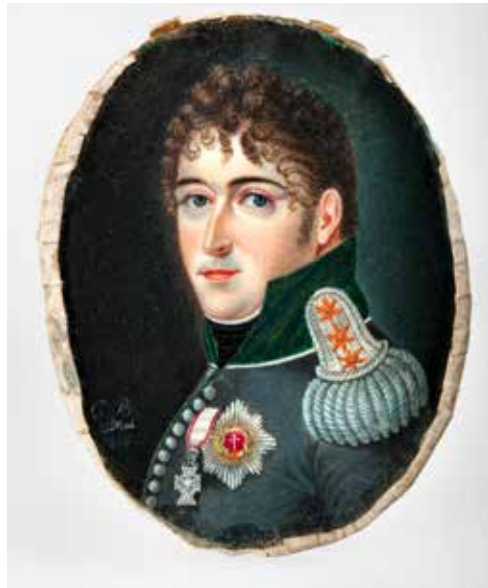
Prins Christian Frederik tiltrådte som statholder i Norge 23. mai 1813. Som halvbror av Frederik 6. var han også tronfølger siden kongen ikke hadde mannlige arvinger. Christian Frederik fikk tidlig et nært forhold til Norge gjennom sin utdannelse, sine vitenskapelige interesser og sitt vennskap med lederen av norske embetsmenn. Under sitt opphold i landet viste han seg som en sjarmerende og handlekraftig mann. Prinsens personlige egenskaper var viktige i det politiske spillet om Norge våren 1814, selv om hans innsats fortsatt er sterkt omdiskutert. Miniaturportrett av Charlotte Berg, datert 22. mai 1814.