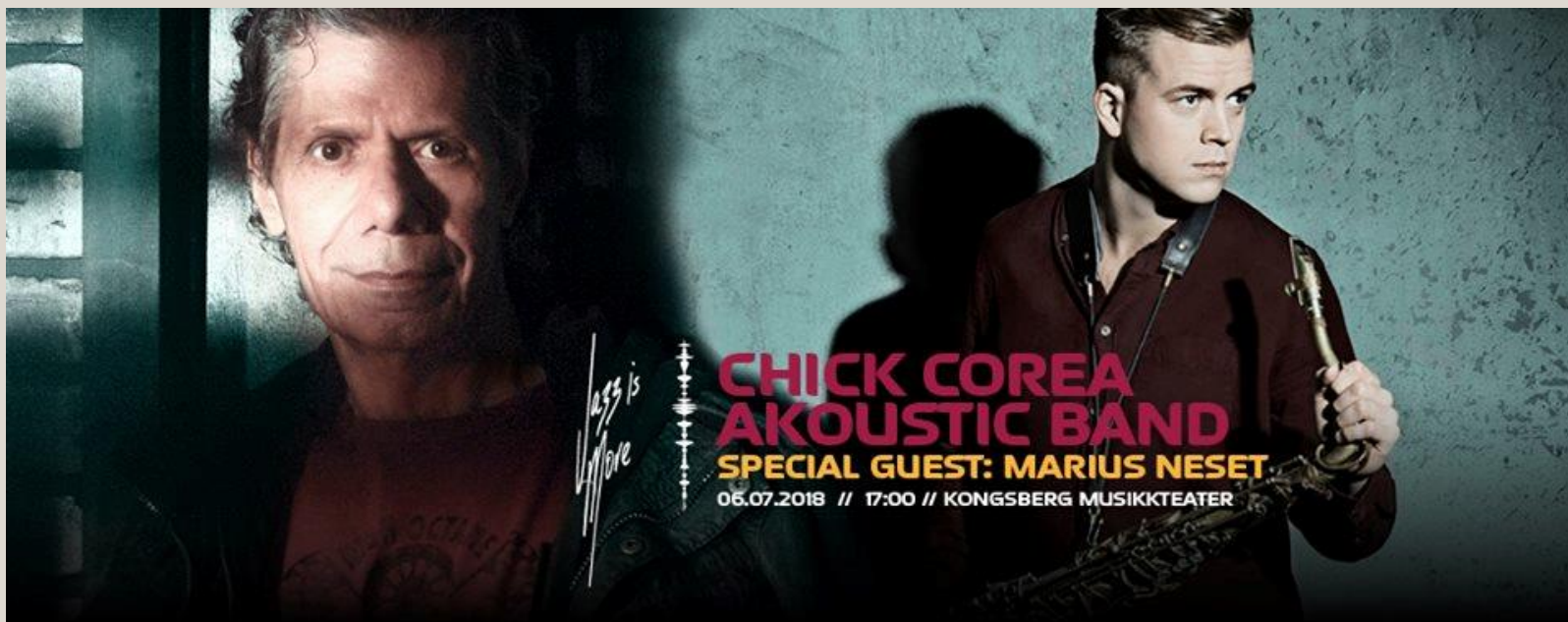
Chick Corea i Kongsberg 2018. Annonsering KJF.