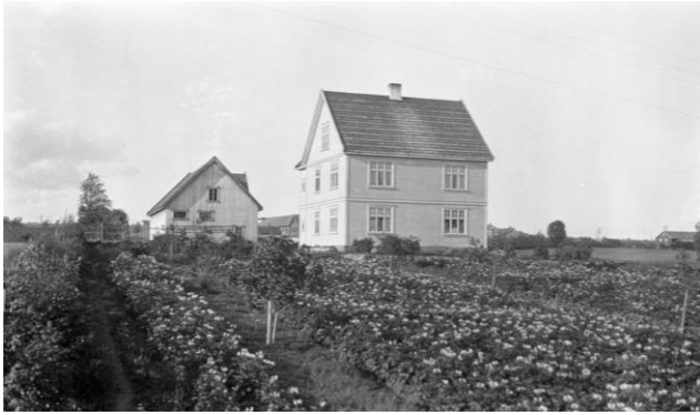
Solbakken 1930.