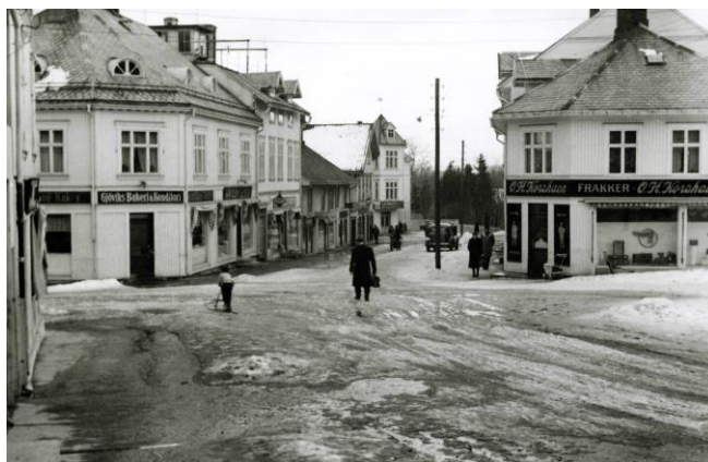
«Gjøvik Bakeri & Konditori» en gang etter 1926.