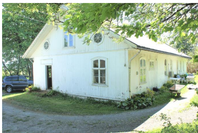
Grande i dag