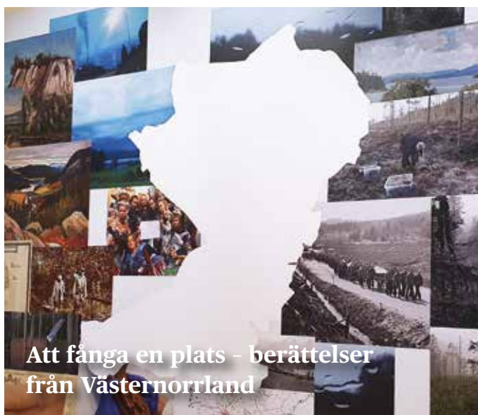
Att fånga en plats - berättelser från Västernorrland