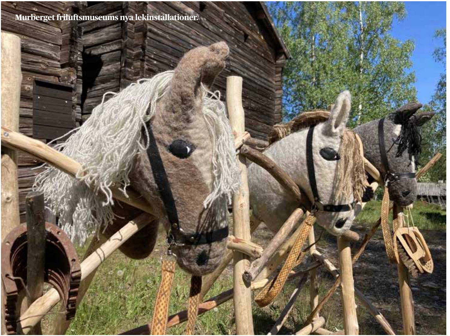
Murberget friluftsmuseums nya lekinstallationer.