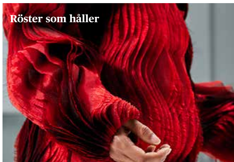
Röster som håller