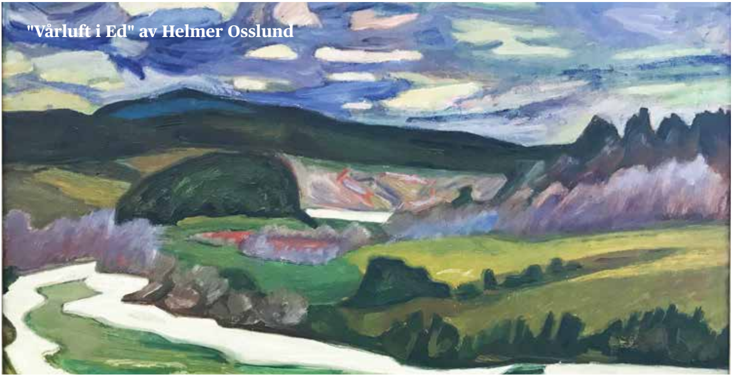
"Vårluft i Ed" av Helmer Osslund