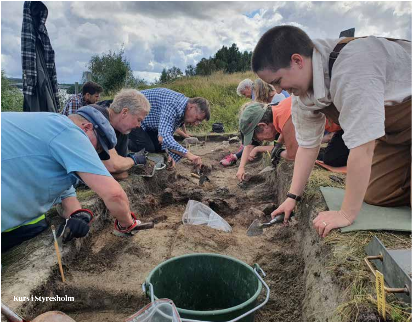
Kurs i Styresholm