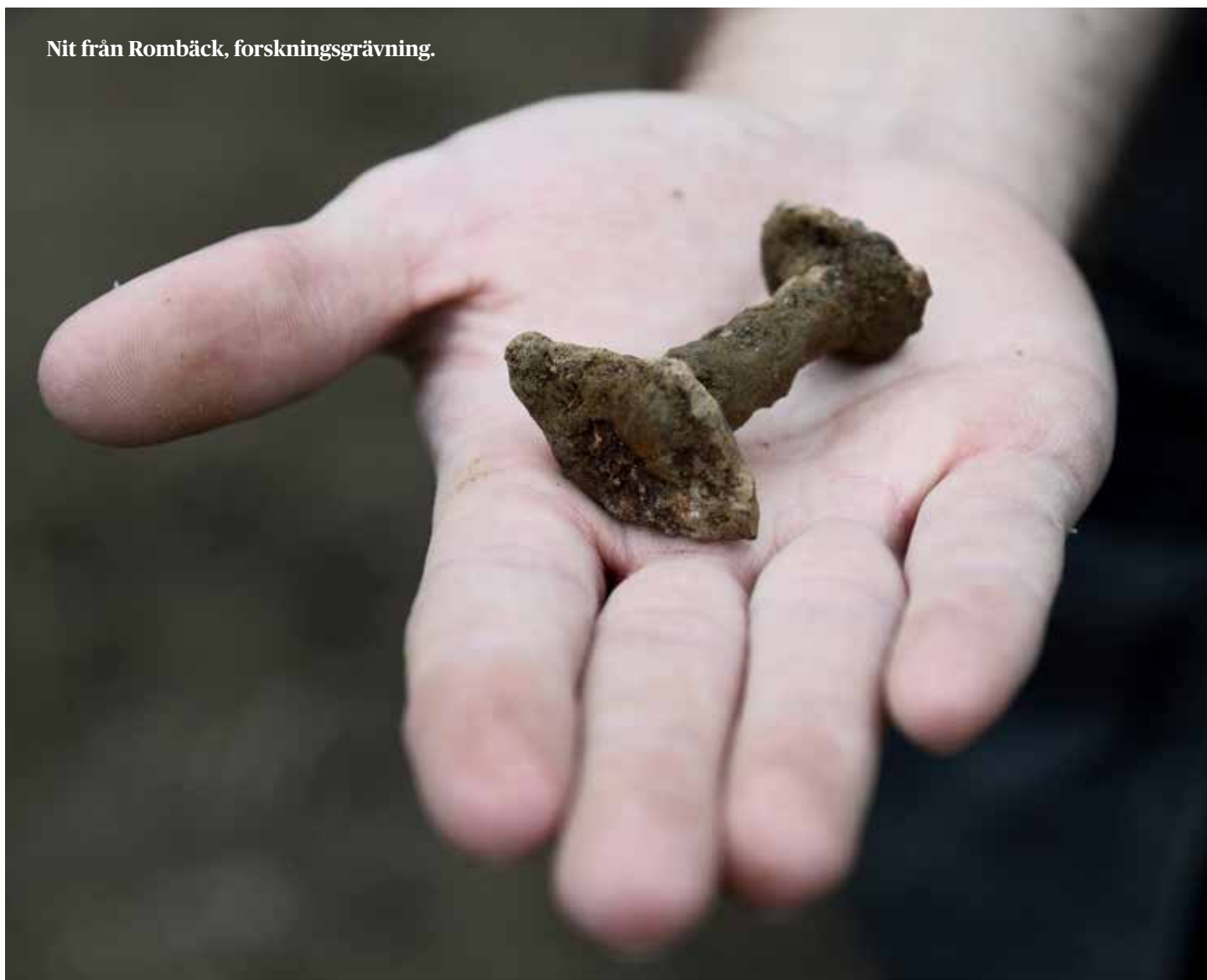
Nit från Rombäck, forskningsgrävning.

Arkeologin har varit mycket uppmärksam i media under året. Man försöker nå ut med arkeologiska rön och upptäckter, speciellt när det är spännande grävningar. Det har under året resulterat i tidnings- och radioreportage, egna inlägg till hemsidan med mera.