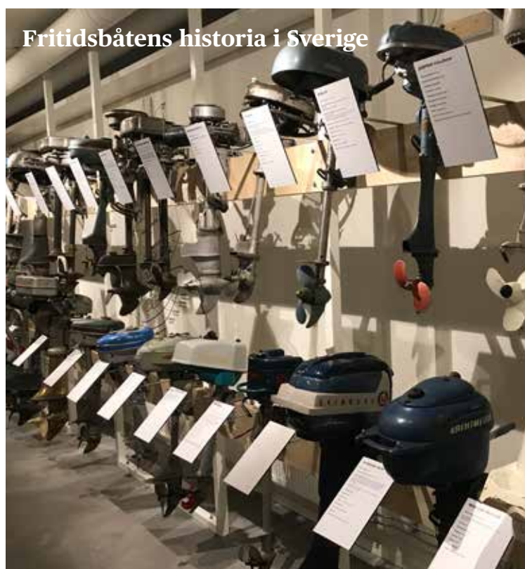
Fritidsbåtens historia i Sverige