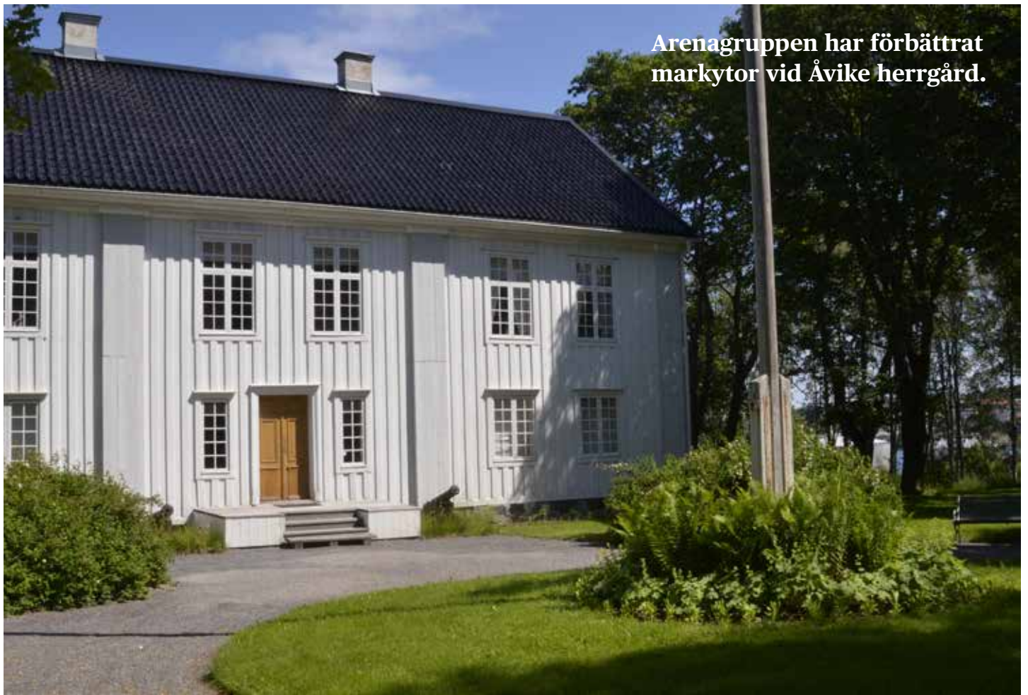
Arenagruppen har förbättrat markytor vid Åvike herrgård.