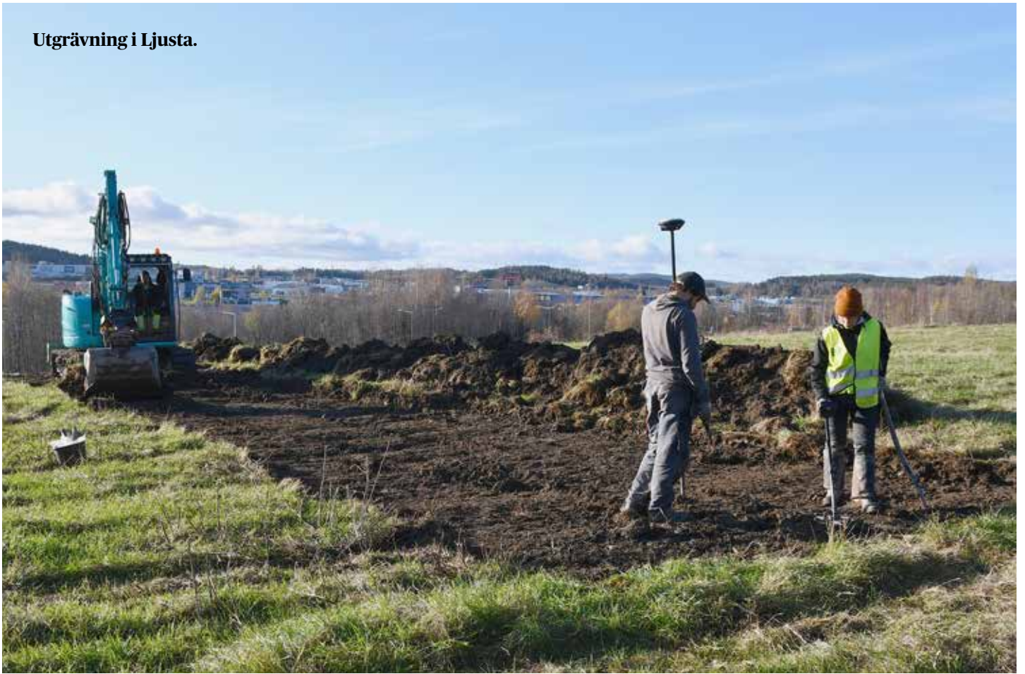
Utgrävning i Ljusta.