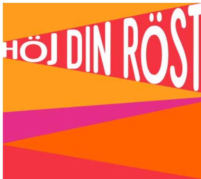
Utställningen "Höj din röst" 27 november-15 maj 2022

Under 2022 kommer aktiviteterna kring demokrati-temat att fortsätta i form av samtal och föredrag och programverksamhet i länet. Utöver dessa konkreta projekt arbetar museet för att integrera rollen som oberoende arena för demokrati i uppdraget i stort, genom att nyttja fysiska och digitala forum för detta.