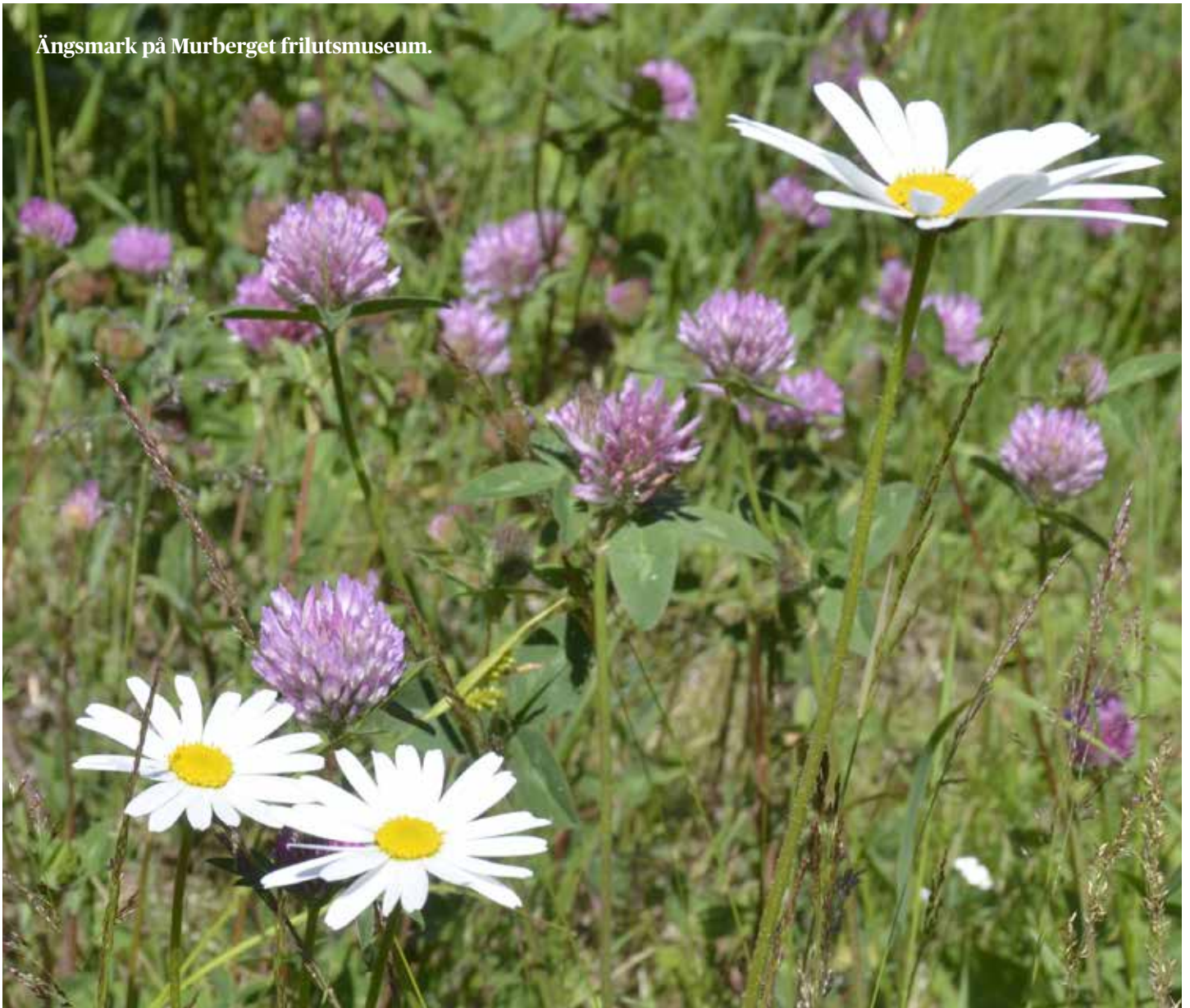
Ängsmark på Murberget frilutsmuseum.