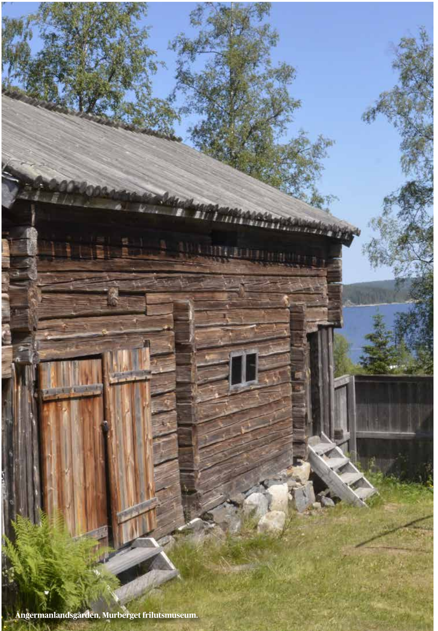
Ångermanlandsgården, Murberget frilutsmuseum.