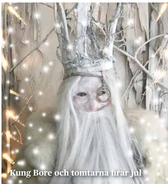
Kung Bore och tomtarna firar jul