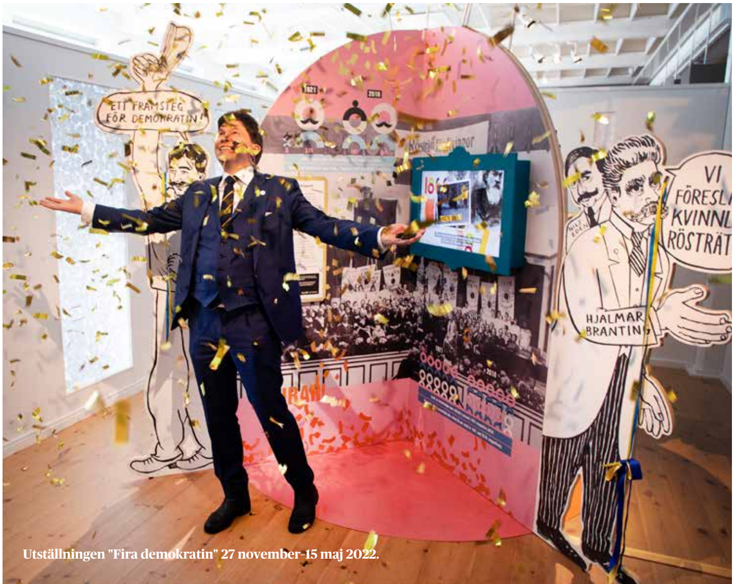
Utställningen "Fira demokratin" 27 november-15 maj 2022.